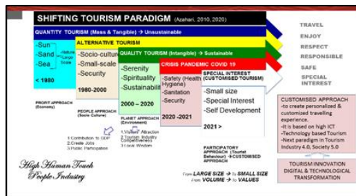
Gambar 1. Pergeseran Paradigma Pariwisata