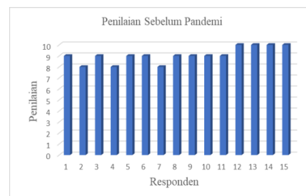
Grafik 1. Hasil Penelitian Pemenuhan Hak Layanan Kunjungan Narapidana Sebelum Pandemi

hak layanan kunjungan narapidana pada periode sebelum pandemi, saat pandemi dan setelah pandemi (periode era normal baru). Kuesioner yang disebarakan terdiri dari 15 (lima belas) pertanyaan terbuka terkait pemenuhan hak layanan kunjungan narapidana yang terbagi menjadi 5 (lima) pertanyaan untuk periode sebelum pandemi, 5 (lima) pertanyaan untuk periode saat pandemi dan 5 (lima) pertanyaan untuk periode setelah pandemi (era normal baru). Penilaian narapidana terhadap pelaksanaan layanan kunjungan berdasarkan kuesioner yang sudah disebarakan dapat penulis interpretasikan dalam grafik berikut: