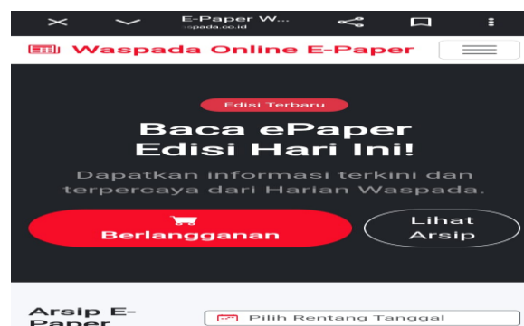
Gambar.3 Situs Resmi Waspada Online E-paper