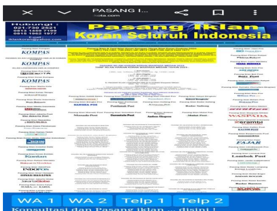
Gambar.7 Situs Resmi Pemasangan Iklan Koran Waspada Medan