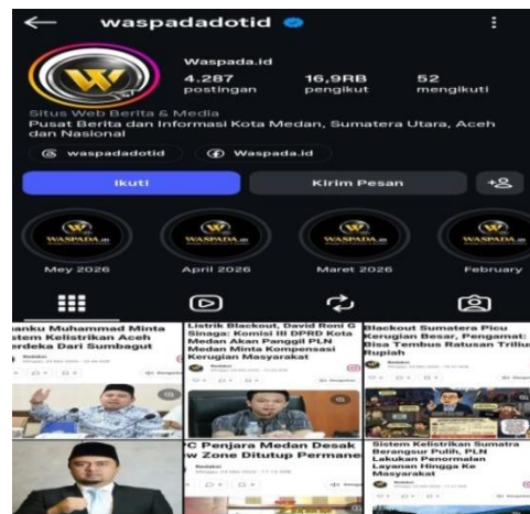
Gambar.4 Sosial Media Instagram Waspada.id

Temuan ini menunjukkan bahwa transformasi digital yang dilakukan Harian Waspada tidak sekadar menjadi sarana adaptasi teknologi, tetapi juga merupakan bentuk strategi konvergensi media untuk mempertahankan relevansi media di tengah perubahan perilaku audiens. Keberhasilan pemanfaatan berbagai platform digital memperlihatkan bahwa efektivitas diseminasi informasi tidak hanya ditentukan oleh kecepatan penyebaran berita, tetapi juga oleh kemampuan media dalam menjangkau berbagai kelompok masyarakat melalui kanal komunikasi yang berbeda.