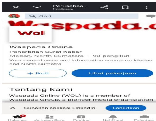
Gambar.6 Situs Resmi LinkedIn Waspada Online

Meskipun media digital menawarkan kecepatan dan kemudahan akses, hasil penelitian menunjukkan bahwa media cetak masih memiliki nilai strategis sebagai sumber informasi yang dipercaya masyarakat. Kondisi ini mengindikasikan bahwa keberadaan media cetak tidak sepenuhnya tergantikan oleh media digital, melainkan mengalami perubahan fungsi menjadi media yang menekankan kedalaman informasi, kredibilitas, dan nilai dokumentasi. Dengan demikian, hubungan antara media cetak dan media digital lebih bersifat komplementer daripada kompetitif .