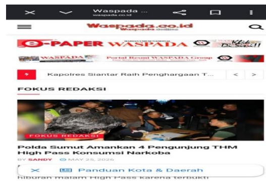
Gambar.1 Situs Resmi Waspada.co.id

informasi. Temuan penelitian menunjukkan bahwa masyarakat tidak lagi bergantung sepenuhnya pada media cetak untuk memperoleh informasi. Kondisi ini sejalan dengan Batubara dan Mutiah (2025) yang menjelaskan bahwa perkembangan teknologi digital telah mengubah pola distribusi dan akses informasi masyarakat melalui berbagai perangkat berbasis internet. Kondisi tersebut mendorong Harian Waspada Medan untuk mengembangkan berbagai platform digital sebagai sarana penyebaran informasi kepada masyarakat luas. Berdasarkan hasil observasi, masyarakat dapat mengakses informasi Harian Waspada secara mandiri melalui berbagai platform digital resmi yang dimiliki oleh Waspada Group. Selain itu, fitur e-paper juga memberikan kesempatan kepada masyarakat untuk membaca versi digital dari surat kabar cetak secara lebih praktis melalui perangkat digital. Portal berita resmi Harian Waspada menjadi media utama dalam menyampaikan informasi aktual terkait peristiwa di Kota Medan, Sumatera Utara, hingga wilayah Aceh.