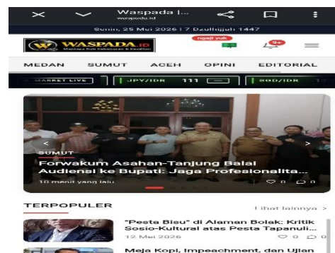
Gambar.2 Situs Resmi Waspada.id