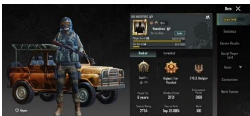
Gambar 4. Akun PUBG Mobile NN

biasanya menghabiskan waktu bermain gim selama 1-3 jam perhari. Informan NN berprofesi sebagai Barista Coffie Shop di Kota Bekasi yang berumur 25 tahun. NN merupakan pemain aktif PUBG Mobile sejak tahun 2018. Jika dibandingkan dengan informan lainnya, NN merupakan player wanita dengan pengalaman bermain terlama yaitu 6 tahun. NN merupakan player aktif yang masih bermain PUBG Mobile hingga hari ini. Rata-rata, NN bermain PUBG Mobile selama 1-2 jam per hari. NN biasa bermain unranked karena NN tidak percaya diri saat bermain sendiri atau solo namun NN tidak jarang bermain dengan party yang sudah ia kenal untuk bermain ranked . NN berdomisili di Harapan Jaya Bekasi Utara.