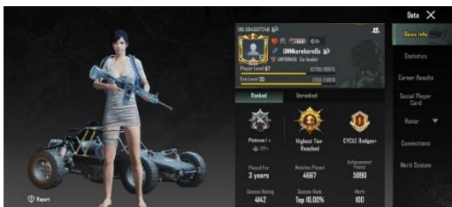
Gambar 5. Akun PUBG Mobile RN

Adapun informan RN berprofesi sebagai kontraktor swasta yang bekerja di bidang konstruksi yang berumur 25 tahun. RN merupakan pemain aktif PUBG Mobile sejak akhir tahun 2020. RN adalah pemain dengan jam terbang yang sangat sedikit dibanding dua informan lainnya namun capaian peringkat RN melebihi dua informan sebelumnya. RN merupakan player aktif yang dalam sehari bisa menghabiskan waktu bermain rata-rata 3-4 jam. Informan RN dapat juga bermain selama 5 hingga 7 jam apabila Informan RN ingin mengejar peringkat yang tinggi hal ini dikatakannya apabila informan sedang ingin bermain dengan serius.