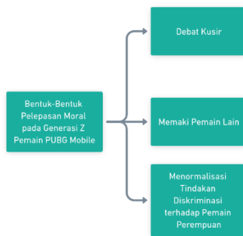
Gambar 7. Bentuk-Bentuk Pelepasan Moral pada Generasi Z Pemain PUBG Mobile

Gambar diatas merupakan temuan dari bentuk pelepasan moral pada Generasi Z pemain PUBG Mobile, yang di temukan peneliti dalam penelitian melalui observasi informan dan wawancara informan dan tidak lupa juga tayangan youtube yang membantu data observasi dan wawancara menjadi dapat di konfirmasi peneliti sebagai jawaban yang benar.