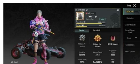
Gambar 3. Akun PUBG Mobile HW

HW dan NN menganggap diri mereka sebagai pemain yang hanya bermain PUBG Mobile untuk mengisi waktu luang. HW dan NN tidak memiliki keinginan untuk berkompetisi memperebutkan peringkat yang tinggi dalam gim PUBG. Sementara itu, RN justru sebaliknya. Ia senang berkompetisi dan berambisi mendapatkan peringkat tertinggi dalam gim. Saat ini, RN berada pada rank Conqueror, sedangkan HW dan NN berada di Ace.