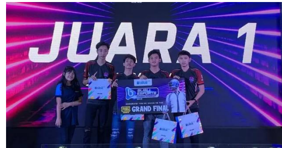
Gambar 2. Tim perwakilan Bekasi yang menjadi pemenang di ajang Blibli Esport

Bekasi pada ajang Blibli Esport Meidini Maya, (2019) salah satu tim yang berhasil masuk ke Grand Final dan menjadi perwakilan Bekasi di ajang Blibli Esport adalah “Supply Bang Danger” (lihat pada Gambar 2)