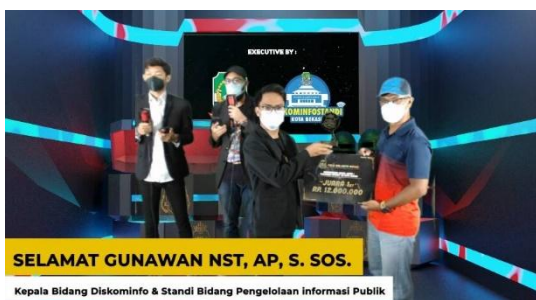
Gambar 1. Penghargaan Juara 1 Pada Turnamen PUBG Mobile Patriot 24 Kota Bekasi

Salah satu wujud pembuktian bahwa generasi Z di Kota Bekasi sangat antusias terhadap PUBG Mobile ini adalah banyaknya pemain di generasi Z yang mengikuti beberapa event seperti turnamen PUBG Mobile Patriot 24 yang sukses digelar sebagai rangkaian Peringatan HUT Kota Bekasi. Event ini meraih animo besar dari masyarakat sejak dimulainya pendaftaran peserta, babak kualifikasi hingga sampai pada babak final dan grand final Pada tahun 2021 (lihat Gambar 1).