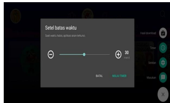
Gambar 5. Setel Batas Waktu

YouTube Kids menyediakan rekomendasi video yang disesuaikan dengan usia anak-anak. Seperti yang ditunjukkan pada Gambar 4.2, platform ini menyarankan berbagai konten seperti lagu anak-anak, kartun, kerajinan tangan, dan topik lainnya. Jika sebuah video dianggap tidak pantas, orang tua dapat melaporkannya untuk ditinjau segera, karena tidak semua konten dapat disaring secara otomatis.