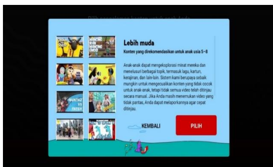
Gambar 4. Rekomendasi Tontonan

Seperti yang telah disebutkan sebelumnya, YouTube Kids dilengkapi dengan fitur yang menyesuaikan konten sesuai dengan usia anak. Orang tua dapat membuat akun berdasarkan kelompok usia anak mereka, dan setiap kali mereka masuk, pertanyaan verifikasi akan ditampilkan yang harus dijawab oleh orang tua.