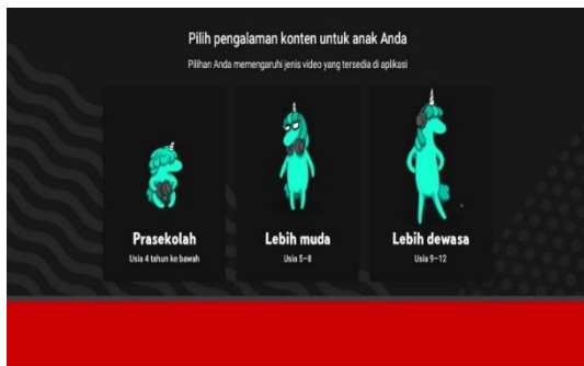
Gambar 3. Pemilihan Usia Anak

YouTube Kids menyediakan berbagai fitur kontrol yang memungkinkan orang tua untuk mengatur waktu menonton anak-anak mereka. Selain itu, platform ini menyediakan alat pelaporan untuk melaporkan konten yang tidak sesuai untuk anak-anak, seperti materi yang mengandung kekerasan, pornografi, atau tema-tema lain yang tidak pantas. Fitur pemblokiran juga disertakan, memungkinkan orang tua untuk membatasi akses ke video yang tidak pantas. Selain itu, YouTube Kids memungkinkan orang tua untuk mengatur preferensi konten berdasarkan kategori usia, sehingga lebih mudah untuk menyaring materi sesuai dengan tahap perkembangan anak-anak mereka.