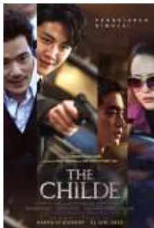
Gambar 3. Poster film The Childe

Dalam film The Childe , Kim Seon-Ho memerankan tokoh gwigongja yang lebih dikenal sebagai chingu, yakni figur enigmatic yang kemudian terungkap sebagai pemburu bayaran dengan keahlian profesional. Alur cerita juga melibatkan karakter Marco yang diperankan oleh Kang Tae-Ju, seorang atlet tinju muda yang terdesak kondisi ekonomi sehingga memilih bertarung di arena ilegal demi membiayai perawatan ibunya. Sementara itu, Go Ara hadir sebagai Yun-Ju, agen intelijen yang beroperasi di bawah perintah Han Yi-Sa dan memiliki kompetensi tinggi dalam penggunaan senjata api dengan target utama Marco. Peran antagonis sentral diisi oleh Kim Kang-woo sebagai Han Yi-Sa, seorang eksekutif puncak yang dikenal luas karena praktik kekuasaan yang brutal. Karya sinema ini memiliki durasi penayangan sekitar satu jam lima puluh delapan menit dan saat ini tersedia untuk disaksikan melalui layanan streaming iQIYI, Vidio, serta Viu.