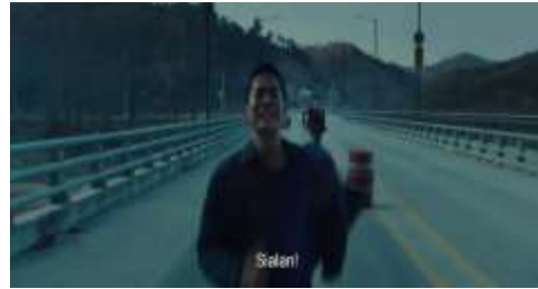
Gambar 4. Scene Marco Dikejar Pria Misterius atau Chingu

terputus. Informasi mengenai keberadaan ayah biologisnya kemudian membuka kemungkinan baru, yang mendorongnya meninggalkan Filipina dan menuju Korea Selatan sebagai langkah awal dalam pencarian tersebut.