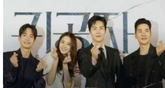
Gambar 1. Pemeran film The Childe

Kompleksitas psikologis semakin diperkuat melalui latar profesi sang tokoh sebagai dokter hewan, sebuah peran sosial yang kontras dengan kecenderungan patologis yang tersembunyi dalam dirinya.