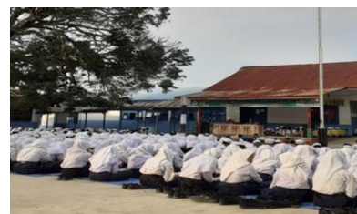
Gambar 2. Tadabbur Alquran

Pertama , Tadabbur Alquran. Kegiatan ini dilaksanakan pada setiap hari selasa dan rabu. Seluruh siswa berkumpul untuk secara bersama-sama membaca ayat suci Alquran dan kemudian dilakukan pentadabburan terutama terkait ayat-ayat toleransi seperti terlihat di dalam gambar berikut ini: