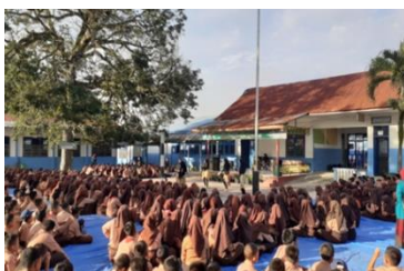
Gambar 3. Kegiatan Yasinan Para Siswa

Kedua, Yasinan. Kegiatan ini dilaksanakan pada setiap hari Kamis secara bersama-sama. Pada hakikatnya kegiatan ini tidak semata-mata dilihat urgensinya dari aspek teologis, tetapi kegiatan ini juga memiliki peranan penting di dalam membentuk spiritualitas para siswa yang berpengaruh terhadap pembentukan sikap perilaku/moralitasnya. Adapun pelaksanaan kegiatan ini dapat dilihat pada gambar berikut: