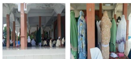
Gambar 3. Shalat Zuhur Berjamaah

Keempat, Shalat Zuhur Berjamaah. Kegiatan ini dilakukan setiap hari oleh seluruh siswa. Dalam pelaksanaannya, persiapan dilakukan secara matang dan terorganisasi. Setelah semua persiapan selesai, maka kegiatan seterusnya dilaksanakan secara rutin sebagai bagian dari aktivitas sehari-hari siswa. Aktivitas dari program ini dapat dilihat pada gambar berikut: