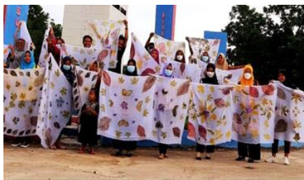
Gambar 2. Proses Pembuatan Batik Ecoprint

Melalui sesi tanya jawab dan diskusi yang berlangsung selama 30 menit diketahui bahwa sebagian besar peserta belum pernah mendapatkan informasi tentang batik ecoprint dan baru mengetahui cara pembuatannya setelah praktek langsung. Setelah dilakukan penyuluhan akan pentingnya pemanfaatan tumbuhan (dedaunan) ini, 90% peserta tertarik dengan pembuatan batik ecoprint terlihat dari antusias peserta yang aktif dalam diskusi seputar batik ecoprint . Oleh karena itu, tim pengabdian akan secara continue membina ibu rumah tangga (peserta pelatihan) Desa Branti Raya dalam pembuatan batik ecoprint yang akan menghasilkan jilbab, kain, maupun kemeja nantinya sehingga bernilai ekonomis. Setelah sesi diskusi