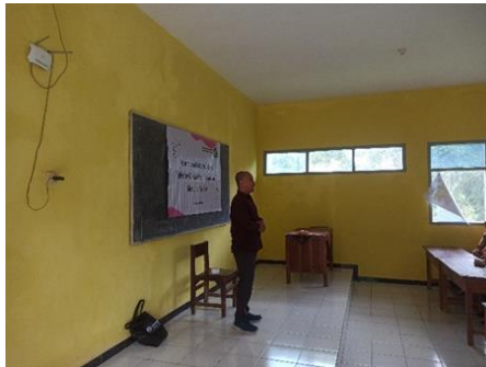
Gambar 2 Pemberian seminar motivasi dengan metode Johari windows