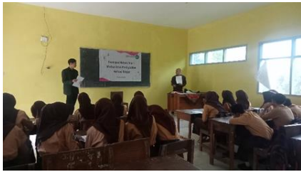
Gambar 1. Kegiatan pemberian pre test