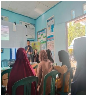
Gambar 2. Tanya Jawab dengan Peserta