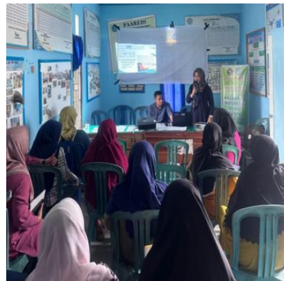
Gambar 1. Sosialisasi dan Penyampaian Materi

Metode yang dilakukan pada pendampingan adalah metode ceramah, dengan penyampaian materi oleh tim pengabdian melalui mensosialisasikan dan memberikan pengetahuan ilmu tentang tujuan, pentingnya dan manfaat dalam memahami tata kelola administrasi usaha.