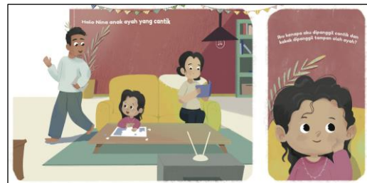
Gambar 4. Tampilan Buku Cerita