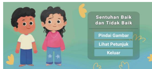
Gambar 3. Tampilan Aplikasi AR

Penggunaan buku cerita dan teknologi AR sebagai media edukasi mendapat tanggapan positif dari peserta, baik orang tua maupun anak-anak. Buku cerita membantu anak memahami konsep pendidikan seksual dengan cara yang sederhana dan menyenangkan, sedangkan teknologi AR memungkinkan visualisasi interaktif yang memudahkan anak dalam memahami anatomi tubuh. Pengalaman ini memungkinkan anak-anak untuk mengenali batasan tubuh secara lebih konkret, memperkuat konsep “area privat” yang penting dalam pendidikan seksual sejak dini.