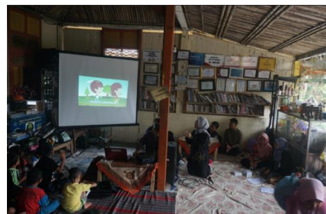
Gambar 1: Kegiatan Penyuluhan di Limbah Pustaka

Peserta menunjukkan partisipasi dan kesungguhan tinggi selama kegiatan penyuluhan. Dalam sesi diskusi dan tanya jawab, peserta aktif bertanya tentang metode yang tepat untuk menyampaikan pendidikan seksual kepada anak-anak. Kesungguhan mereka terlihat juga dari keterlibatan dalam kegiatan storytelling dan praktik AR yang membantu memperkuat pemahaman. Partisipasi aktif ini menunjukkan penerimaan yang baik terhadap metode edukasi yang digunakan.