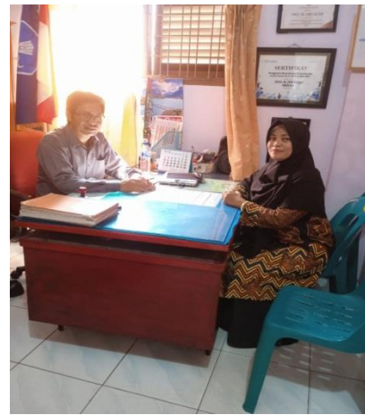
Gambar 2 Diskusi dengan Kepala Sekolah untuk Menentukan Jadwal kegiatan