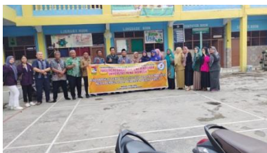
Gambar 4 Foto dengan Peserta Kegiatan

Kegiatan di hari kedua tinggal melakukan pendampingan guru bagi yang belum bisa membuat media pembelajaran yang belum bisa. Bagi guru yang sudah bisa diarahkan untuk membuat media pembelajaran dalam bentuk yang lain, seperti video dan media yang lainnya. Setelah dilakukan pendampingan bagi guru dalam membuat media pembelajaran dengan aplikasi canva, langkah selanjutnya mendampingi guru dalam mengunggah hasil karyanya ke media sosial.