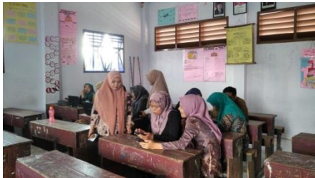
Gambar 3 Foto Kegiatan

belum mempunyai akun dan mengajari guru menggunakan aplikasi canva tanpa melalui akun. Setelah semua guru sudah dapat mengakses aplikasi canva kemudian guru dilatih membuat media pembelajaran menggunakan aplikasi canva. Setelah selesai kegiatan hari pertama maka guru ditugaskan untuk berlatih membuat media pembelajaran di rumah. Hal tersebut bertujuan agar dapat dilihat kemampuan guru pada kegiatan di hari kedua. Kegiatan hari kedua dilaksanakan pada hari Senin, 13 Mei 2024.