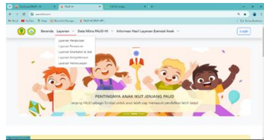
Gambar 2. Tampilan Website

Website terdiri dari berbagai fitur yang dapat membantu kemitraan dua arah antara satuan PAUD dengan mitra layanan esensial dan tentunya membantu orang tua untuk dapat memantau progress perkembangan anak selama di sekolah. Satuan PAUD dapat memberikan berbagai macam informasi hasil layanan melalui laman login, dan orang tua dapat mengakses hasil layanan melalui informasi hasil layanan.