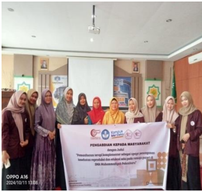
Gambar 4. Foto Bersama