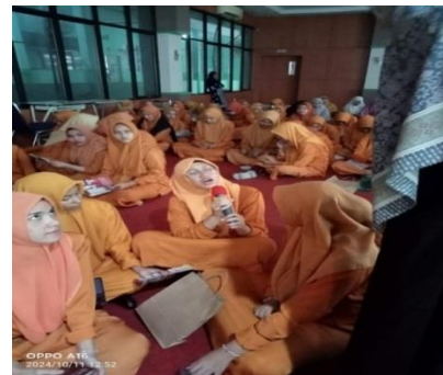
Gambar 2. Tanya Jawab