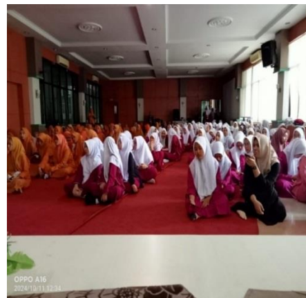
Gambar 3. Peserta Remaja Putri