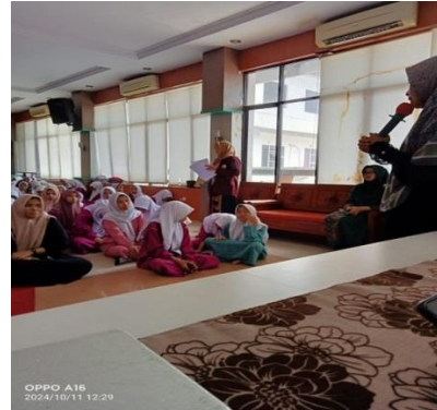
Gambar 1. Pemaparan Materi

Masalah kesehatan reproduksi yang umum di kalangan remaja termasuk kehamilan yang tidak diinginkan, aborsi, aktivitas seksual di luar nikah, kekerasan seksual, eksploitasi, dan gangguan menstruasi seperti dismenore. Untuk masalah menstruasi seperti dismenore, remaja putri dapat memilih perawatan non-obat, seperti pijat akupresur.