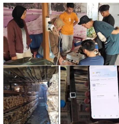
Gambar 4. Proses Instalasi Sistem Penyiraman Otomatis berbasis IoT pada Kumbung Jamur Tiram.

Pada proses Instalasi terlebih dahulu dilakukan dengan menghubungkan perangkat Sensor Suhu dan kelembapan kepada relay dan Pompa, Juga aplikasi pada smartphone android dengan aplikasi pada rlay pompa dan sensor.