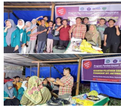
Gambar 3. Pelatihan dan Penyuluhan Terkait Instalasi Penyiraman Otomatis berbasis IoT pada Jamur Tiram.

a. Peningkatan pengetahuan terkait Penggunaan Penyiraman Otomatis berbasis IoT Pasca Penyuluhan dan Pelatihan