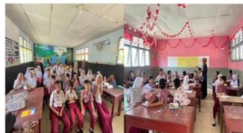
Gambar 3. Pelaksanaan Kegiatan Perpustakaan Keliling di SD Swasta TPI Janji