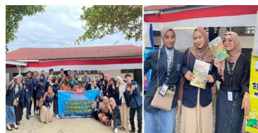
Gambar 2. Foto Kegiatan Pelaksanaan PKM

Kegiatan ini dimulai pada tanggal 24 Agustus 2024, berlangsung satu hari penuh di SD Swasta TPI Janji, dengan melibatkan siswa kelas 4, 5, dan 6 sebagai peserta utama. Selain itu, guru, kepala sekolah, pustakawan, dan tim pengabdian dari Universitas Labuhanbatu turut berperan sebagai pendamping.