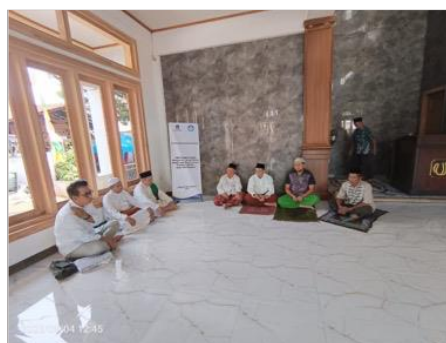
Gambar 2. Tahap pendahuluan

Kegiatan PkM ini dimulai dengan tahap pendahuluan. Pada tahap ini, tim pelaksana PkM berkunjung langsung ke Masjid Jami Daruttaqwa dan bertemu dengan pengurus Dewan Kemakmuran Masjid (DKM) untuk berdiskusi dan menganalisa kebutuhan mitra. Dari tahap pendahuluan dan analisa kebutuhan, dapat diperoleh data bahwa mitra memerlukan website sebagai media dakwah dan dokumentasi aktifitas kerohanian dan pembangunan atau pemeliharaan masjid. Berangkat dari data analisa kebutuhan tersebut, maka tim pelaksana PkM memutuskan untuk mengusung program PkM dengan judul “PkM Pengembangan Website Masjid Jami’ Daaruttaqwa (Tahun Kesatu).”