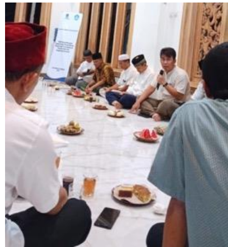
Gambar 5. Pendampingan pemanfaatan bagi mitra

Meskipun telah diberikan pelatihan pada tahap keempat, namun mitra masih mengalami kendala yaitu lupa cara untuk menggunakan fitur edit teks dan unggah foto atau video ke dalam website. Melalui proses pendampingan ini, mitra dapat tetap bertanya dan berdiskusi dengan tim pelaksana PkM sehingga proses pemanfaatan website masjid dapat tetap berjalan efektif.