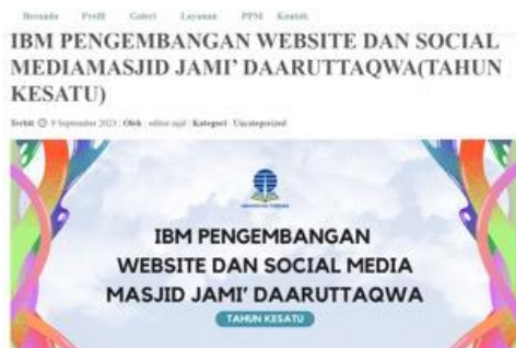
Gambar 3. Website Masjid Daruttaqwa

Pada tahun pertama, program PkM ini difokuskan pada pengembangan website masjid dengan manfaat yang telah dipublikasikan oleh beberapa pelaksana PkM terdahulu (Pratama, 2022; Silvy Angelina dkk., 2022; Sufarnap dkk., 2022). Setelah tahap pendahuluan selesai, selanjutnya adalah tahap pertama yaitu pengembangan website dengan memperhatikan kebutuhan masjid Daruttaqwa. Pengembangan website dilakukan oleh tim pelaksana PkM yang berkolaborasi dengan salah satu mahasiswa Program Studi (Prodi) S1 Sistem Informasi (SI) sebagai anggota pelaksana. Pengembangan website dilaksanakan selama 6 (enam) minggu dimulai dari pembelian nama domain, sewa hosting, instalasi content management system (CMS), instalasi template CMS khusus masjid. Setelah desain website selesai dikembangkan, pada pelaksanaan tahap kedua yaitu tim pelaksana PkM kembali bertemu dengan pengurus DKM Daruttaqwa untuk mendiskusikan kesesuaian antara desain website dengan kebutuhan mitra. Dari hasil diskusi tersebut, dapat diperoleh data bahwa tim pengurus DKM Daruttaqwa memberi masukan kepada tim pelaksana PkM agar desain websitenya disesuaikan dengan desain yang bernuansa Islami bukan desain website yang selayaknya dipakai oleh perkantoran atau umum. Tim pelaksana PkM menerima masukan tersebut dan menyesuaikan desain website sesuai masukan dari pengurus DKM.