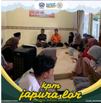
Gambar 4. Tahap Evaluasi

Evaluasi dilakukan untuk menilai efektivitas seminar dalam meningkatkan pemahaman dan kesadaran peserta mengenai bullying . Kuesioner dan wawancara digunakan untuk mengumpulkan feedback dari peserta.