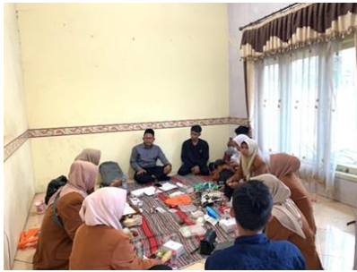
Gambar 2. Tahap Persiapan

termasuk sistem suara yang jelas dan optimal, layar proyektor untuk presentasi, serta perlengkapan game untuk kampanye anti- bullying yang akan digunakan selama sosialisasi. Semua elemen ini disusun dengan teliti untuk memastikan bahwa pesan yang disampaikan dapat diterima dengan baik oleh audiens dan tujuan dari kegiatan pengabdian masyarakat ini tercapai secara maksimal. Persiapan yang matang pada tahap ini diharapkan dapat mendukung keberhasilan tahap-tahap berikutnya dalam program pengabdian masyarakat ini.