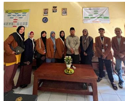
Gambar 1. Tahap Observasi

Kemudian berdasarkan hasil wawancara dengan salah satu dewan guru, kelompok pengabdian masyarakat menemukan bahwa bullying terhadap teman sebaya sering terjadi, terutama di kelas IX A, dan ada kecenderungan siswa MTs melakukan tindakan bullying secara verbal maupun non verbal. Adanya tindakan bullying tersebut disadari oleh pihak sekolah bahwa bakat bullying yang dimiliki oleh siswa perlu disadarkan dengan adanya kegiatan seminar dan sosialisasi anti bullying . Madrasah Tsanawiyah Nurul Huda Japura Lor berharap bahwa dengan adanya acara tersebut bakat bullying siswa tidak semakin parah dan siswa kelas IX menjadi model anti bullying untuk kelas VII dan VIII.