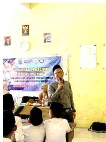
Gambar 3. Tahap Pelaksanaan