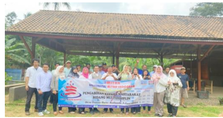
Gambar 3. Dokumentasi Tim PkM UMITRA dan Peserta serta perangkat Desa Way Tebing Ceba