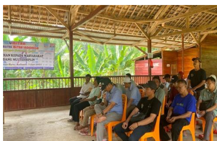
Gambar 2. Penyampaian Materi Strategi Digital Marketing dan Diskusi