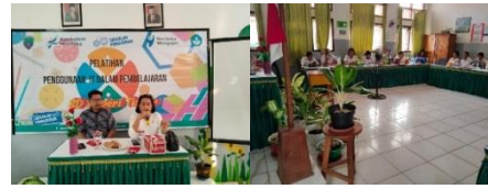
Gambar 2. Pelaksanaan Pelatihan

Pada sesi 3, peserta terlibat dalam workshop yang menitikberatkan pada pengembangan strategi pembelajaran berbasis AI. Workshop ini bertujuan untuk memberikan pemahaman mendalam kepada peserta tentang cara merancang strategi pembelajaran yang memanfaatkan teknologi AI untuk meningkatkan efektivitas dan efisiensi pembelajaran di sekolah dasar. Penggunaan AI dalam pembelajaran memungkinkan adaptasi terhadap kebutuhan individu siswa, dan peningkatan interaksi dalam proses pembelajaran. Selama sesi ini, peserta diberikan contoh konkret tentang penerapan AI dalam berbagai aspek pembelajaran, termasuk penyajian materi dan penilaian siswa. Mereka juga didorong untuk berkolaborasi dalam kelompok untuk merancang strategi pembelajaran yang sesuai dengan mata pelajaran dan tujuan pembelajaran mereka.