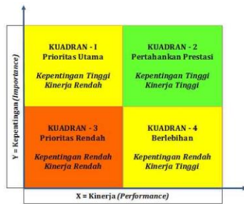
Gambar 1. Kuadran Importance Performance Analysis (IPA)