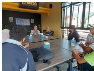
Gambar 1. Peserta dan Narasumber Pelatihan E-Commerce

Para peserta memperhatikan dengan fokus ketika diberikan penjelasan mengenai pelatihan e-commerce . Peserta juga aktif bertanya mengenai hal yang belum dipahami atau ingin lebih diketahui terkait e-commerce . Selain itu, pada angket respon dari peserta menunjukkan hasil setuju bahwa pelatihan ini sangat menarik dan bermanfaat. Dengan adanya pelatihan e-commerce mencakup teori umum, persiapan, dan contoh berjualan online pada marketplace yang sudah disampaikan oleh salah satu tim, para peserta pengabdian kepada masyarakat mulai tertarik untuk memanfaatkan aplikasi tersebut baik untuk berjualan maupun membeli produk secara online . Dikesempatan pengabdian ini tim memberikan kesempatan kepada peserta untuk praktek langsung pembuatan akun, membuat nama toko, memasukkan deskripsi produk, jenis-jenis produk yang dijual para peserta, tetapi masih harus membutuhkan pendampingan. Namun demikian dengan adanya pelatihan ini masyarakat mulai mengerti dan melek teknologi, sehingga dapat memanfaatkan handphone , laptop yang ada dengan maksimal.