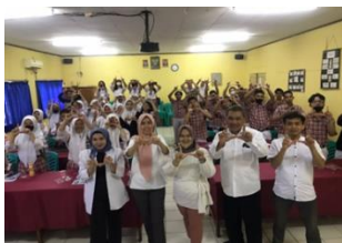
Gambar 2. Memberikan Materi Tentang Kewirausahaan