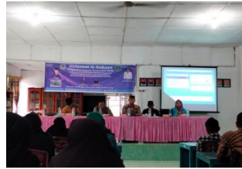
Gambar 1. Narasumber menyampaikan materi.

Saat ini pembeli menginginkan adanya transparansi dari produsen berupa komposisi khususnya di bagian makanan mengenai kehalalan produk yang akan dikonsumsi. Hal ini menjadi peluang bagi pelaku UMKM untuk melengkapi produknya dengan sertifikat halal sehingga dapat mencapai kepuasan pembeli. Paparan materi mulai dari penyampaian prinsip halal dan thoyib suatu produk terutama berbagai ketentuan yang diatur dalam UU BPJPH No.33 tahun 2014, Pelaku UMKM juga diberikan materi pelatihan terkait pentingnya kepuasan pelanggan serta bagaimana prospek usaha bisa terbuka semakin luas dengan adanya sertifikasi halal tersebut. Tujuan utama dari kegiatan ini adalah untuk membentuk pemahaman peserta bahwa sertifikasi halal tidak hanya berhenti sampai tersertifikasinya produk pangan mereka, melainkan banyak dampak positif lain yang akan diperoleh. Pelaksanaan pendampingan tentang cara mengajukan sertifikasi produk halal melalui laman ptsp.halal.go.id serta dilanjutkan dengan kegiatan pada jadwal yang disepakati antar pendampingan dengan peserta terkait.