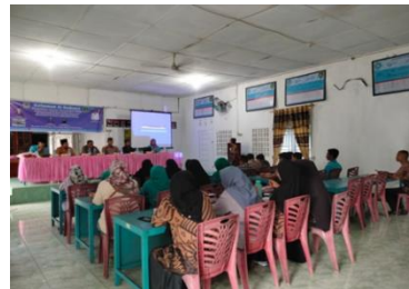
Gambar 2. Peserta kegiatan sosialisasi dan pendampingan sertifikasi produk halal