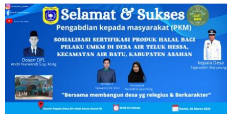
Gambar 3. Spanduk kegiatan

Pasca kegiatan pengabdian dilaksanakan para pelaku UMKM sebanyak 15 peserta dalam kegiatan tersebut memiliki pemahaman yang lebih mendalam tentang pentingnya sertifikasi halal pada produk mereka, bertambahnya pengetahuan tentang pengaruh sertifikasi halal terhadap kepuasan pembeli produk mereka, terciptanya prospek usaha, serta terbentuknya pemahaman dan pengalaman mengenai langkah-langkah pengajuan sertifikasi halal. Pengisian penilaian kuisisioner digunakan sebagai capaian keberhasilan kegiatan terlihat pada gambar. Cara pengisian kuisisioner dengan isian seperti terlihat pada tabel 1.