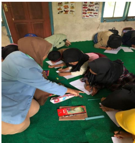
Gambar 2. Penulis memberikan bimbingan cara menuliskan kaligrafi huruf hijaiyah khat Naskhi kepada para siswa.

dilatihkan pada minggu pertama. Sama seperti sebelumnya, masing-masing siswa telah diinstruksikan untuk membawa dua pensil serta sebuah karet gelang yang akan digunakan untuk menulis kaligrafi huruf hijaiyah. Kegiatan pelatihan pada tahap ini dilaksanakan pada tanggal 16 Februari 2023.