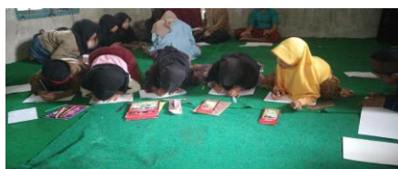
Gambar 4. Mewarnai kaligrafi asmaul husna.