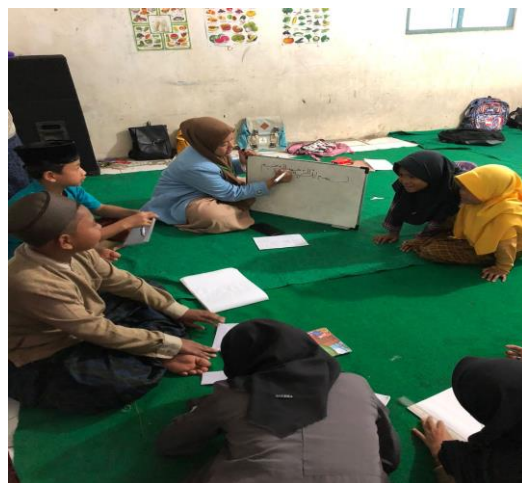
Gambar 1. Kegiatan pelatihan dasar membuat Huruf arab menggunakan Khat Naskhi

dilakukan selama 30 menit, yakni mulai dari pukul 14.00 sampai dengan pukul 14.30 dan dilaksanakan pada tiap hari Kamis. Pada minggu pertama merupakan tahap pengenalan dan pelatihan seni kaligrafi secara sederhana. Pada tahap ini, penulis mengenalkan seni kaligrafi dan memberikan pelatihan seni kaligrafi secara sederhana kepada santriwan dan satriwati DTA Tegal Heas dengan mengajarkan menulis kaligrafi dari satu persatu huruf hijaiyah terlebih dahulu. Sebelumnya, masing-masing santri telah diinstruksikan untuk membawa dua pensil serta sebuah karet gelang yang akan digunakan untuk menulis kaligrafi huruf hijaiyah. Pelatihan seni kaligrafi ini dilakukan dengan cara penulis mencontohkan terlebih dahulu pada para santri cara menuliskan kaligrafi, kemudian para santri mempraktikkan menulis kaligrafi dan apabila ada santri yang merasa kesulitan penulis memberikan bantuan. Kegiatan pelatihan pada tahap ini dilaksanakan pada tanggal 9 Februari 2023.