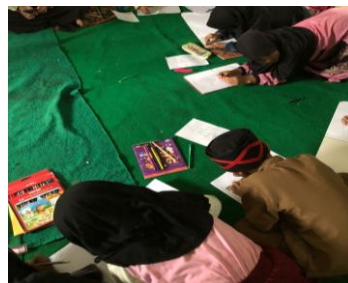
Gambar 3. Membuat kaligrafi lafadz Bismillahirrahmanirrahim yang ditulis oleh para siswa.

Pada minggu ketiga merupakan tahapan pelatihan menggabungkan kaligrafi huruf-huruf hijaiyah dalam bentuk kata, yakni dengan menuliskan kaligrafi dari lafadz Bismillahirrahmanirrahim. Pada tahap ini, pelatihan kaligrafi yang dilakukan sudah mulai naik tingkat kesulitannya. Para siswa dilatih untuk dapat menuliskan kaligrafi dalam bentuk kata, yakni dengan menuliskan lafadz Bismillahirrahmanirrahim. Sama seperti tahapan-tahapan sebelumnya, pelatihan menuliskan kaligrafi lafadz Bismillahirrahmanirrahim ini dilakukan dengan cara penulis mencontohkan terlebih dahulu kepada para siswa cara menuliskan kaligrafi lafadz Bismillahirrahmanirrahim, kemudian para santri mempraktikkan menulis kaligrafi dan apabila ada siswa yang merasa kesulitan penulis memberikan bantuan. Kegiatan pelatihan pada tahap ini dilaksanakan pada tanggal 23 Februari 2023.