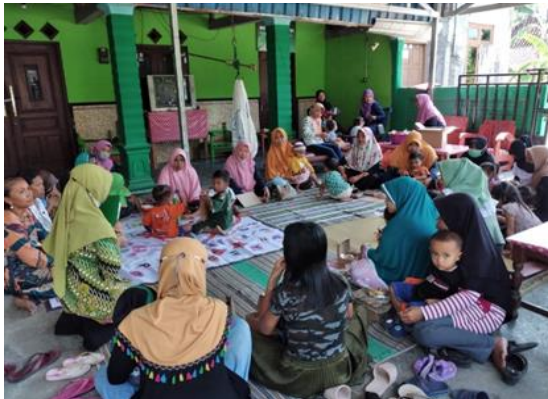
Gambar 1 Pelaksanaan Kegiatan Pengabdian Kepada Masyarakat