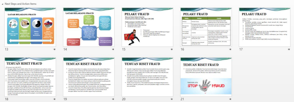
Gambar 2 Foto Materi Sesi Kedua

Selanjutnya, tim penulis melakukan diskusi terlebih dahulu mengenai materi pendahuluan yang telah diberikan. Sebagian besar siswa-siswi belum memiliki persepsi yang baik mengenai fraud itu sendiri. Kecenderungan yang mereka ketahui bahwa fraud hanya korupsi, sogok-menyogok, atau yang berhubungan dengan uang. Tim penulis menyampaikan bahwa fraud bukan hanya berkaitan dengan uang saja tetapi segala perbuatan atau tindakan melawan hukum yang dilakukan secara sengaja dalam rangka memanipulasi, menyampaikan pernyataan tidak secara benar atau memberikan laporan yang menyesatkan kepada orang lain guna memperoleh keuntungan bagi diri atau kelompoknya. Pengertian tersebut sama dengan yang dikemukakan oleh The Association of Certified Fraud Examiners (ACFE) . Pada sesi kedua, tim penulis memberikan pengetahuan lebih mendalam mengenai fraud seperti latar belakang, pelaku, korban dan contoh, serta temuan - temuan riset terkait fraud .