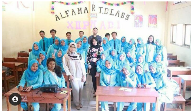
Gambar 4 Foto Kegiatan di SMK Bina Harapan Ciseeng.

Di akhir sesi, tim penulis membuka diskusi kembali dan juga menanyakan apa yang telah mereka dapatkan selama mengikuti penyuluhan ini. Beberapa peserta memberikan respon yang positif tentang pengetahuan baru yang mereka dapatkan melalui kegiatan ini. Lalu diakhir sesi tim penulis memilih penanya dan penjawab terbaik dan berfoto bersama sebagai dokumentasi kegiatan dan diakhiri dengan pemberian pesan moral dan doa penutup.