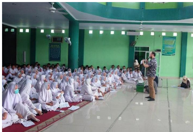
Gambar 5 Foto Kegiatan di SMA Muhammadiyah 23 Jakarta.