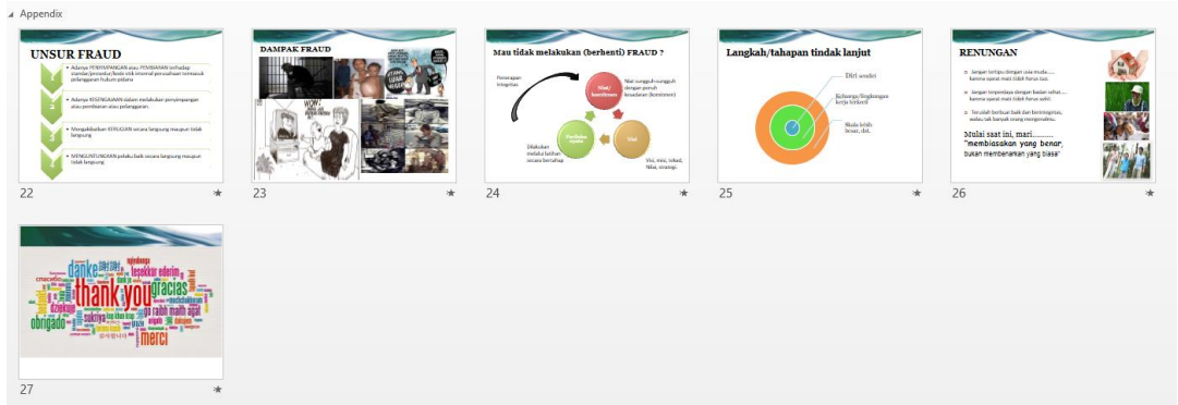
Gambar 3 Foto Materi Sesi Ketiga

Di akhir sesi, tim penulis membuka diskusi kembali dan juga menanyakan apa yang telah mereka dapatkan selama mengikuti penyuluhan ini. Beberapa peserta memberikan respon yang positif tentang pengetahuan baru yang mereka dapatkan melalui kegiatan ini. Lalu diakhir sesi tim penulis memilih penanya dan penjawab terbaik dan berfoto bersama sebagai dokumentasi kegiatan dan diakhiri dengan pemberian pesan moral dan doa penutup.