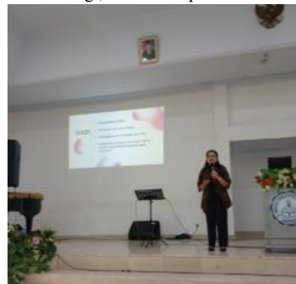
Gambar 1. Tim Menyampaikan Materi

Tahap pelaksanaan dilakukan dalam bentuk kuliah umum akademik dengan pendekatan edukatif-partisipatif. Narasumber menyampaikan materi secara sistematis mengenai posisi kitab-kitab nabi dalam Perjanjian Lama, hakikat suara kenabian, serta keteladanan para nabi seperti Amos, Yesaya, Yeremia, dan Yehezkiel dalam menghidupi pesan Allah di tengah krisis umat. Penyampaian materi tidak hanya diarahkan pada pemahaman historis dan teologis, tetapi juga pada relevansi suara kenabian bagi mahasiswa teologi masa kini. Setelah pemaparan materi, kegiatan dilanjutkan dengan dialog akademik agar peserta dapat mengajukan pertanyaan, memberi tanggapan, dan merefleksikan makna suara kenabian bagi pelayanan gereja, pendidikan teologi, dan kehidupan sosial.