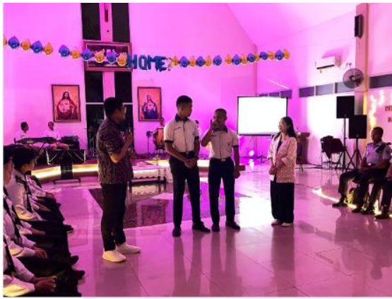
Gambar 2. Tanya jawab dengan Mahasiswa/i

Hasil kegiatan memperlihatkan bahwa tema yang diangkat memiliki daya edukatif yang kuat karena menyentuh persoalan mendasar dalam kehidupan mahasiswa, yaitu pergumulan antara nilai iman dan kecenderungan moral yang dapat melemahkan kepribadian. Pembahasan mengenai tujuh dosa pokok memberikan ruang bagi mahasiswa untuk memahami bahwa persoalan spiritualitas tidak hanya berkaitan dengan kehadiran dalam ibadah, tetapi juga dengan kualitas batin yang tercermin dalam sikap, keputusan, relasi sosial, dan disiplin hidup (Fuertes and Dugan 2021). Dengan demikian, ibadah kampus berperan sebagai sarana pembinaan yang menghubungkan dimensi teologis dengan realitas kehidupan sehari-hari mahasiswa.