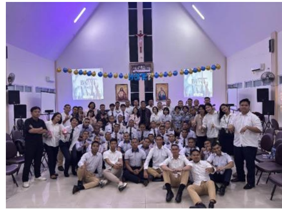
Gambar 3. Dokumentasi Kegiatan

Dampak kelima adalah munculnya dorongan untuk membangun disiplin rohani yang berkelanjutan (Purwanto and Wulandari 2020). Ibadah kampus menjadi titik awal bagi mahasiswa untuk menata kembali kehidupan spiritualnya, terutama dalam hal doa, ibadah, penguasaan diri, dan komitmen hidup sesuai nilai-nilai Kristiani. Kegiatan ini memperlihatkan bahwa pembinaan spiritualitas tidak cukup dilakukan melalui satu kali kegiatan, tetapi perlu dilanjutkan melalui ibadah rutin, pendampingan rohani, diskusi kelompok, dan pembinaan karakter secara berkesinambungan.