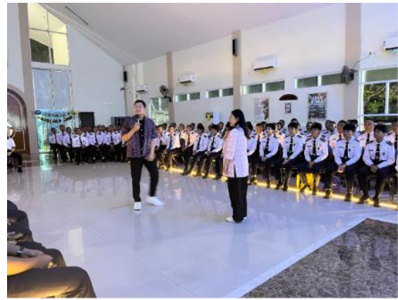
Gambar 3. Dokumentasi Kegiatan

Internalisasi nilai moral dalam kegiatan ini tidak terjadi melalui pendekatan indoktrinatif, tetapi melalui penyadaran. Mahasiswa diajak untuk mengenali bahwa tujuh dosa pokok merupakan realitas yang dapat hadir dalam bentuk halus dan sering kali tidak disadari. Dengan demikian, kegiatan ini menghasilkan kesadaran reflektif bahwa pembinaan spiritualitas harus dimulai dari kemampuan membaca diri sendiri. Kesadaran tersebut menjadi modal penting bagi mahasiswa untuk membangun karakter yang lebih matang, bertanggung jawab, dan berorientasi pada nilai-nilai Kristiani.