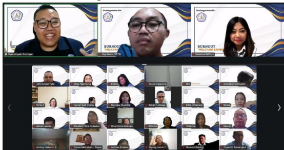
Gambar 1. Pelibatan Peserta dalam Tanya Jawab

Selain pemaparan materi, peserta juga dilibatkan dalam sesi diskusi dan tanya jawab. Sesi ini bertujuan untuk menggali pengalaman konkret peserta terkait tekanan pelayanan serta memberikan ruang bagi mereka untuk merefleksikan kondisi pribadi maupun dinamika pelayanan di komunitas masing-masing. Dengan demikian, kegiatan seminar tidak hanya berfungsi sebagai transfer pengetahuan, tetapi juga sebagai ruang dialog pastoral-edukatif yang membantu peserta memahami persoalan burnout secara lebih personal dan kontekstual.