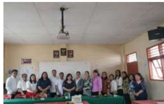
Gambar 4 : Foto Bersama

Keberlanjutan kegiatan ini bagi peserta dan narasumber memberikan target untuk membuat 1 book chapter yang ditargetkan akan selesai pada tahun 2026. Tahap evaluasi dilakukan yaitu monitoring progres penulisan hingga target book chapter selesai. Setiap peserta menyelesaikan draf book chapter sesuai jadwal yang ditetapkan kualitas naskah akan dikoreksi apakah memenuhi standar akademik setelah proses review dan revisi. Narasumber akan memberikan feed back atau umpan balik tertulis dan lisan kepada peserta.