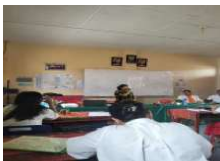
Gambar 1. Narasumber Menjelaskan Literasi Akademik

Pelatihan penulisan book chapter bagi guru PAUD yang diselenggarakan oleh IGTKI Kabupaten Tapanuli Utara pada April 2025 menunjukkan capaian yang terukur pada aspek pengetahuan, sikap, dan keterampilan peserta. Pada awal pelaksanaan kegiatan, sebagian besar guru PAUD masih memiliki keterbatasan dalam memahami konsep literasi akademik, sistematika karya ilmiah, serta prosedur penulisan book chapter .