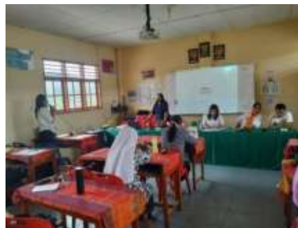
Gambar 2. Guru Bertanya tentang Book Chapter

adalah menulis book chapter yang mengaitkan praktik PAUD dengan prinsip pendidikan anak. Literasi akademik membantu guru mengaitkan pengalaman kelas dengan teori, membuat pembelajaran lebih reflektif dan terstruktur.