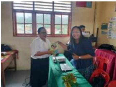
Gambar 3. Narasumber memberikan hadiah

Selanjutnya lakukan pemeriksaan akhir pada format buku dan daftar pustaka yang akan dikoreksi editor. Pastikan naskah siap untuk dikirim, rapi, dan profesional. Naskah akan melewati proses review. Lakukan revisi final jika ada masukan, kemudian book chapter diterbitkan. Sesuai dengan arahan ketua IGTKI meminta narasumber sebagai editor dalam book chapter ini.