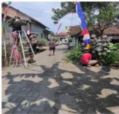
Gambar 2. Pemasangan Lampu IoT di jalur utama

Empat titik lampu jalan otomatis berhasil dipasang pada area yang sebelumnya minim penerangan: jalan utama, area pos ronda, jalur perkebunan, dan pertigaan selatan. Lampu IoT dikonfigurasi dengan timer otomatis sehingga menyala pada malam hari dan mati pada pagi hari. Hasil pengamatan menunjukkan peningkatan intensitas aktivitas warga pada malam hari karena visibilitas lingkungan meningkat. Implementasi ini konsisten dengan temuan (Firmansah et al., 2025) yang menjelaskan bahwa penerangan publik yang baik mengurangi potensi tindak kriminal dan meningkatkan kenyamanan pengguna jalan. Adapun bukti pelaksanaan pada gambar 2 berikut.