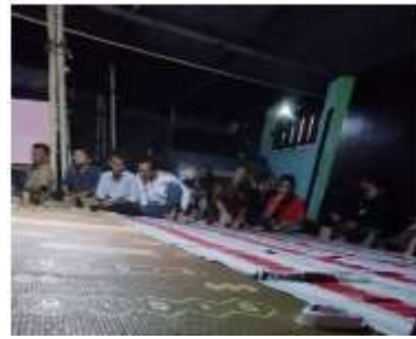
Gambar 3. Pelatihan Pengoperasian CCTV IoT melalui Aplikasi

Pelatihan diberikan kepada pengurus RT dan warga terpilih untuk memastikan keberlanjutan pemakaian teknologi. Materi mencakup: cara mengakses CCTV melalui aplikasi, Melakukan monitoring aktivitas secara real time, penjadwalan lampu otomatis, pemeriksaan perangkat (maintenance ringan), penanganan gangguan umum (reset, reconnect, gangguan sinyal), gambar 3 berikut menunjukkan kegiatan pelatihan.