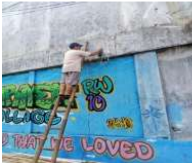
Gambar 1. Pemasangan CCTV IoT

tanpa batasan lokasi. Gambar 1 berikut adalah proses pemasangan CCTV IoT.