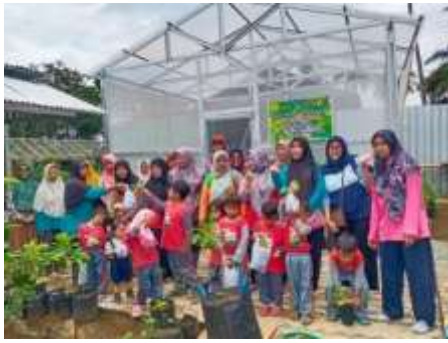
Gambar 5. Kunjungan murid taman kanak-kanak ke greenhouse

Gambar 5. menunjukkan bahwa program pengabdian masyarakat menghasilkan satu unit greenhouse percontohan yang dibangun di area KWT Makmur Berkah. Greenhouse ini berfungsi sebagai tempat praktik lanjutan sekaligus wahana agroedukasi bagi warga sekitar.