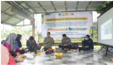
Gambar 1. Sesi penyuluhan dan diskusi dalam pelatihan budidaya melon hidroponik di KWT Makmur Berkah

Kegiatan pelatihan budidaya melon hidroponik di Desa Kutasari, Kecamatan Baturaden, Kabupaten Banyumas, dilaksanakan dengan melibatkan dua belas anggota Kelompok Wanita Tani (KWT) Makmur Berkah. Kegiatan ini mencakup penyuluhan teori, demonstrasi praktik, hingga pendampingan lapangan selama empat minggu.