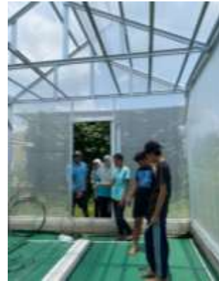
Gambar 3. Kegiatan instalasi irigasi tetes dengan pengarah tim pendampinging

Gambar 2. Dan Gambar 3. Menunjukkan rancangan sistem irigasi tetes yang digunakan pada pelatihan budidaya melon hidroponik di KWT Makmur Berkah. Larutan nutrisi dialirkan dari penampungan air melalui pipa utama dan disalurkan ke setiap polybag menggunakan drip stick, sehingga distribusi air dan nutrisi ke tanaman berlangsung merata dan efisien.