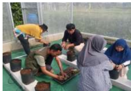
Gambar 4. Kegiatan praktik penanaman bibit melon hidroponik oleh anggota KWT Makmur Berkah

Gambar 2. Dan Gambar 3. Menunjukkan rancangan sistem irigasi tetes yang digunakan pada pelatihan budidaya melon hidroponik di KWT Makmur Berkah. Larutan nutrisi dialirkan dari penampungan air melalui pipa utama dan disalurkan ke setiap polybag menggunakan drip stick, sehingga distribusi air dan nutrisi ke tanaman berlangsung merata dan efisien.