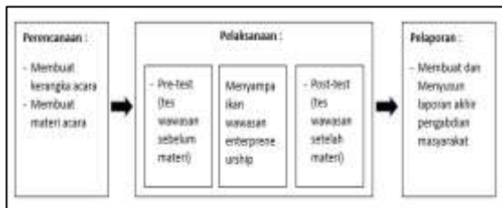
Bagan 1. Rangkaian Tahapan Pengabdian

Langkah serta bentuk penyampaian dalam kegiatan pengabdian ini dirancang untuk memastikan keberlanjutan program sehingga tetap berjalan sesuai harapan dan mampu mencapai tujuan utamanya, yakni memberikan edukasi kewirausahaan kepada mahasiswa tingkat akhir di Surabaya Timur. Untuk dapat mencapai tujuan tersebut, disertakan juga kerangka workshop yang mana ditunjukkan pada tabel berikut ini: