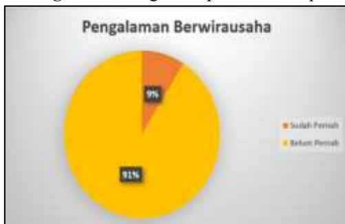
Bagan 2. Kerangka Berpikir Workshop

Langkah serta bentuk penyampaian dalam kegiatan pengabdian ini dirancang untuk memastikan keberlanjutan program sehingga tetap berjalan sesuai harapan dan mampu mencapai tujuan utamanya, yakni memberikan edukasi kewirausahaan kepada mahasiswa tingkat akhir di Surabaya Timur. Untuk dapat mencapai tujuan tersebut, disertakan juga kerangka workshop yang mana ditunjukkan pada tabel berikut ini: