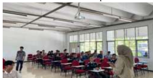
Gambar 1. Suasana Pemaparan Materi

Pemaparan materi berisi tentang konsep dasar untuk ber- mindset menjadi seorang entrepreneur , sikap-sikap yang perlu dimiliki seorang entrepreneur , dan mengukur kesiapan serta niat menjadi seorang entrepreneur . Materi-materi ini sesuai dengan tujuan dari kegiatan workshop yang diadakan, yakni mempersiapkan mahasiswa untuk menjadi wirausaha atau entrepreneur yang tanggap dalam melihat peluang, berani dalam berinovasi dan mengambil risiko secara terukur. Materi-materi ini menjadi tambahan penting untuk menguatkan mindset mahasiswa.