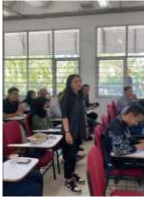
Gambar 2. Peserta Aktif Berpartisipasi

Dari hasil pengolahan data yang diperoleh dari kuesioner, menunjukkan bahwa data nilai wawasan peserta workshop berdistribusi normal (uji Kolmogorov-Smirnoff sig. > 0.05), maka dari itu uji perbandingan yang digunakan adalah uji Paired Sample T-Test, yang mana bisa dilihat pada Tabel 3. Berdasarkan uji Paired Sample T-Test didapati bahwa terdapat perbedaan signifikan (sig.(2-tailed) < 0.05) terhadap wawasan peserta pada sebelum dan sesudah mengikuti workshop .