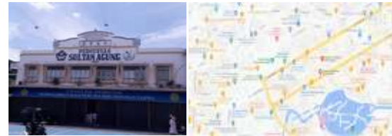
Gambar 1. Tempat Pengabdian

Selain itu, pendekatan ini juga merujuk pada prinsip Project-Based Learning (PjBL) (Thomas, 2000) yang menekankan keterlibatan aktif peserta didik dalam proyek autentik dan bermakna. Dalam kegiatan pengabdian masyarakat, model ini memperkuat peran fasilitator sebagai pendamping yang membimbing siswa selama proses perencanaan, pelaksanaan, dan refleksi proyek agar nilai-nilai Pancasila dapat diterapkan secara kontekstual. Pendekatan ini sejalan dengan Panduan P5 (Kemendikbudristek, 2022) yang menegaskan pentingnya peran mentor dalam menumbuhkan kemampuan berpikir kritis, kolaborasi, serta penghayatan nilai kebhinekaan dan cinta tanah air secara berkelanjutan.