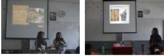
Gambar 4. Eksplorasi Budaya Nusantara

dari bentuk rumah adat dan busana tradisional yang sebelumnya hanya mereka kenal secara visual. Hasil ini memperkuat temuan (Sulistiyaningrum, T., & Fathurrahman, 2023) bahwa eksplorasi budaya kontekstual dapat menumbuhkan kesadaran kebhinekaan dan kebanggaan identitas nasional.