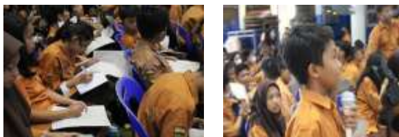
Gambar 7. Refleksi dan Tindak Lanjut

kegiatan ini membantu mereka memahami arti persatuan dalam perbedaan, menghargai budaya lain, dan memperkuat rasa cinta tanah air (Gambar 7). Guru dan fasilitator kemudian menyusun rencana tindak lanjut, yaitu menjadikan kegiatan serupa sebagai agenda tahunan sekolah dalam bentuk “Festival Kebhinekaan” agar nilai-nilai yang telah tertanam dapat terus berkembang.