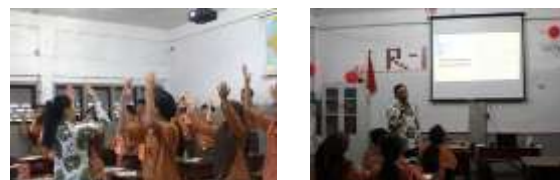
Gambar 3. Pembagian Kelompok Lintas Kelas

Setelah modul disepakati, dilakukan pembagian kelompok siswa secara lintas kelas dan lintas etnis. Tujuannya untuk melatih kolaborasi, saling menghormati, dan kemampuan bekerja sama dalam keberagaman. Setiap kelompok terdiri atas 10-12 siswa yang mewakili berbagai kelas dan latar belakang budaya. Guru memainkan peran aktif dalam kelompok, memantau dinamika kelompok dan memberikan arahan bila terjadi ketidakseimbangan peran (Gambar 3). Melalui pendekatan ini, siswa belajar menyesuaikan diri dengan teman berbeda karakter dan budaya, serta membangun komunikasi efektif. Data lapangan memperlihatkan bahwa sebagian besar kelompok menunjukkan peningkatan kerja sama dan rasa saling menghargai selama proses proyek berlangsung.