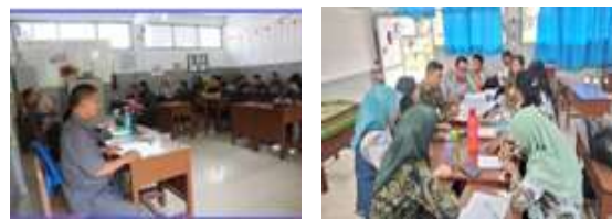
Gambar 2. Diskusi Tim Pengabdian dan Panitia Pembagian Kelompok Lintas Kelas

diatur dalam Panduan Resmi Kemendikbudristek (Badan Standar, Kurikulum & Kementerian Pendidikan, Kebudayaan, Riset, dan Teknologi Indonesia, 2022).