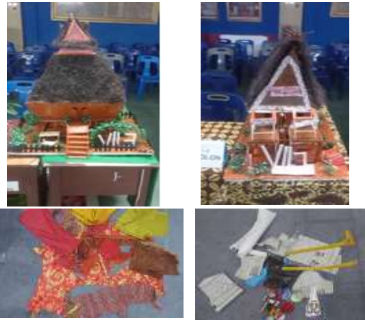
Gambar 5. Produk Artefak Proyek