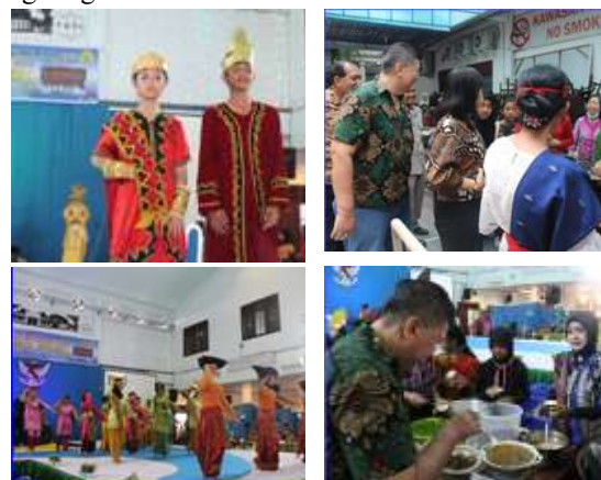
Gambar 6. Festival Budaya Indonesia

Puncak kegiatan adalah pameran budaya sekolah yang diselenggarakan di aula SMP Swasta Sultan Agung. Kegiatan ini diikuti oleh para guru serta orang tua peserta didik, dan masyarakat sekitar. Setiap kelompok menampilkan artefak proyek disertai penjelasan lisan mengenai makna simbolik dari rumah adat, busana, dan makanan khas yang mereka pilih. Pameran ini menjadi ajang apresiasi dan refleksi kolektif terhadap keragaman budaya Indonesia (Gambar 6). Hasil observasi menunjukkan peningkatan rasa bangga siswa terhadap budaya nasional, terlihat dari antusiasme mereka menjelaskan produk kelompok kepada pengunjung. Hal ini sejalan dengan temuan (Reskia, D., Kaharuddin, & Wardah, 2025) yang menekankan pentingnya pameran budaya sebagai sarana internalisasi nilai kebhinekaan global dalam lingkungan sekolah.