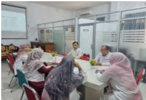
Gambar 6. FGD Persiapan Pengabdian

Berdasarkan hasil dari FGD pelaksana menemukan kebutuhan, kesulitan, dan kemungkinan peluang pengembangan modul intervensi expressive art counseling dapat sangat terbantu dengan melakukan FGD selama pengabdian masyarakat menggunakan pendekatan expressive art counseling . Melalui FGD, calon pelaksana dapat memberikan masukan mengenai efisiensi, batasan waktu, materi, dan kejelasan instruksi untuk setiap kegiatan kreatif yang telah direncanakan. Fasilitator dapat menyempurnakan modul berdasarkan hasil diskusi ini, yang menjamin bahwa intervensi komunitas memiliki kualitas yang lebih tinggi, lebih relevan, dan lebih mudah diadaptasi oleh peserta.