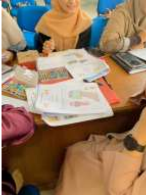
Gambar 10. Pelatihan Expressive Drawing Sesi 1