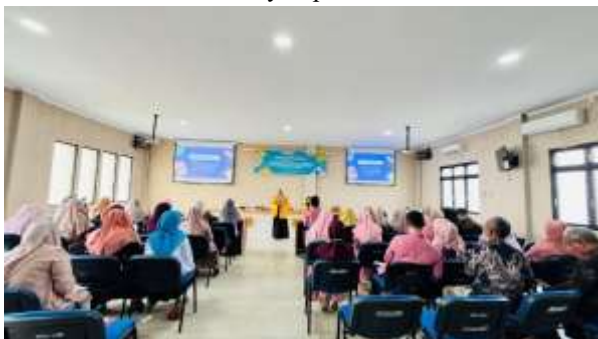
Gambar 9. Penyampaian Materi 2

Guru BK yang berpartisipasi dalam inisiatif pengabdian masyarakat yang mencakup expressive art counseling yang menunjukkan peningkatan perilaku, pengetahuan, dan kemampuan. Melalui inisiatif pengabdian masyarakat seperti lokakarya seni ekspresif, guru bimbingan dan konseling dapat mempraktikkan apa yang mereka ajarkan di kelas kepada anak-anak (Davis et al., 2018). Siswa mendapatkan manfaat dari peningkatan ekspresi emosi, manajemen stres, pengembangan keterampilan sosial, dan kepercayaan diri (Elfenbein, 2023). Siswa dapat mengekspresikan perasaan dan pengalaman mereka dengan cara yang aman dengan berpartisipasi dalam kegiatan artistik