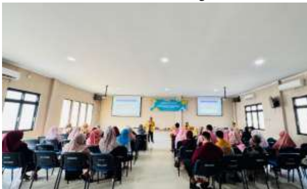
Gambar 8. Penyampaian Materi 1