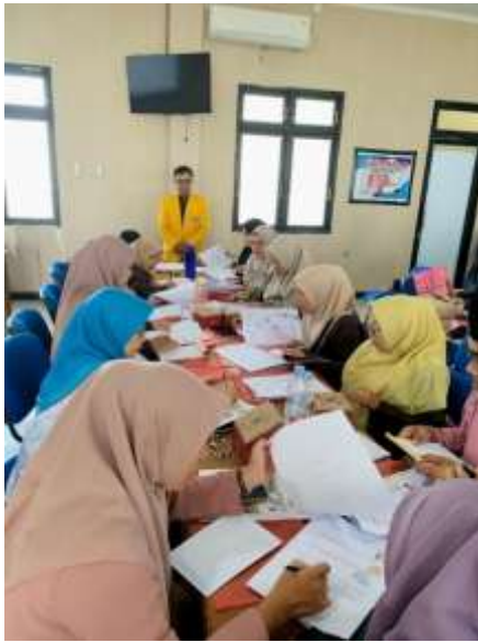
Gambar 14. Pelatihan Expressive Journaling Sesi 1