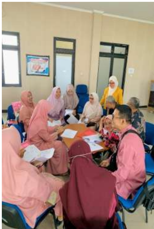
Gambar 13. Pelatihan Expressive Writing Sesi 2

Penggunaan writing expressive dalam pengabdian masyarakat yang melibatkan guru BK sangat meningkatkan kemampuan mereka untuk mengenali dan menyelesaikan masalah dengan siswa (Ningtiyas & Yuwono, 2020). Instruktur BK belajar