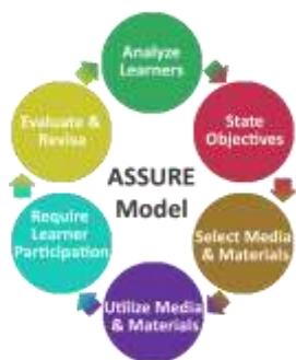
Gambar 4. Skema Model Assure

Pengabdian masyarakat menggunakan pendekatan ASSURE dalam intervensi guru BK di MGBK karena tujuan proyek ini adalah untuk meningkatkan kemampuan konseling guru BK. Setiap fase dalam proses pembelajaran ASSURE diselesaikan secara menyeluruh dan bertahap untuk menghasilkan hasil terbaik, sehingga konsep materi lebih mudah dipahami atau dipahami melalui contoh atau gambar (Saputra & Saputra, 2021). Model ini dapat digunakan dalam pembelajaran kelas, kelompok, atau individu (Smaldino & Lowther, 2020). Oleh karena itu, menggunakannya untuk mengirimkan konten dalam layanan ini dianggap tepat.