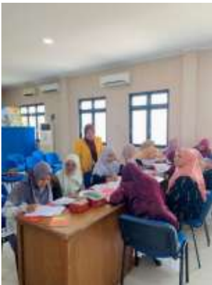
Gambar 11. Pelatihan Expressive Drawing Sesi 2

Memasukkan drawing expressive ke dalam proyek pengabdian masyarakat pada guru BK telah meningkatkan pemahaman dan kemampuan guru BK dalam menangani dan mengatasi permasalahan psikologis siswa. Guru BK dapat meningkatkan kemampuan mereka dalam mengenali dan menangani masalah kesehatan mental, meningkatkan ketahanan, dan menumbuhkan sikap yang baik terhadap layanan konseling di lingkungan sekolah dengan menggunakan modul expressive art counseling untuk merancang cara-cara inovatif. Melalui latihan ini, guru dapat mengekspresikan diri, melepaskan tekanan, dan mendapatkan kepercayaan diri dalam menjalankan tugas konseling mereka.