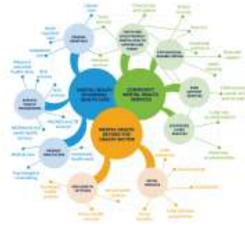
Gambar 3. Jaringan layanan kesehatan mental berbasis komunitas untuk mental anak dan remaja

Pengabdian Masyarakat Bertajuk “Pelatihan Expressive Art Counseling untuk meningkatkan Keprofesionalan Guru BK dalam Meningkatkan Kesehatan Mental Siswa di Kota Payakumbuh” bertujuan untuk dapat meningkatkan keterampilan konseling Guru BK dalam melaksanakan pra konseling yaitu meningkatkan keterbukaan diri siswa dalam upaya mencapai kesehatan mental siswa.