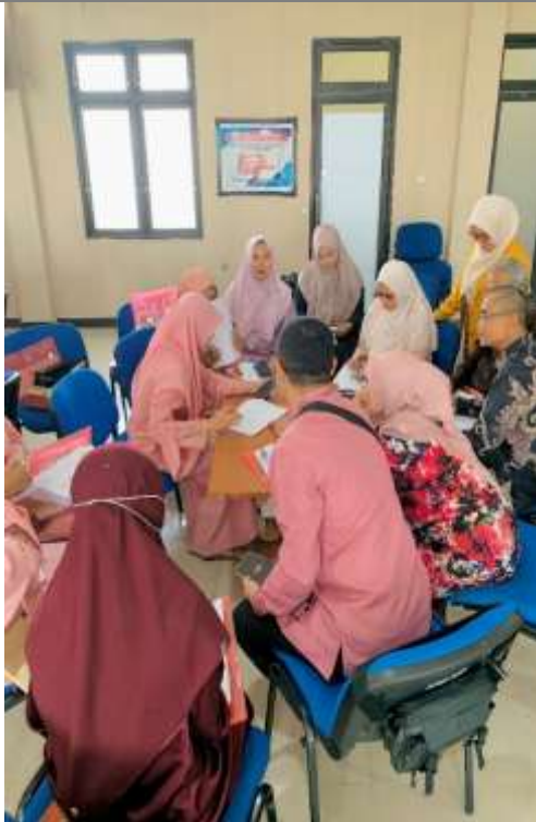
Gambar 12. Pelatihan Expressive Writing Sesi 1