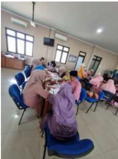
Gambar 15. Pelatihan Expressive Journaling Sesi 2

Penggunaan journaling expressive dalam proyek pengabdian masyarakat pada guru BK telah meningkatkan kemampuan mereka secara signifikan dalam mengatasi stres akibat beban kerja dan kesulitan terkait pekerjaan lainnya (Sackett & Mckeeman, 2017). Terapi jurnal memungkinkan