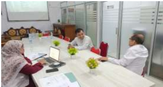
Gambar 5. FGD Persiapan Pengabdian

pertama untuk memastikan peserta memahami arah pembicaraan adalah mendefinisikan tema dan tujuan FGD dengan jelas (O.Nyumba et al., 2018). Peneliti kemudian merumuskan serangkaian pertanyaan untuk membantu fasilitator menemukan informasi yang relevan (Akyildiz & Ahmed, 2021). Langkah penting lainnya dalam proses seleksi peserta adalah memastikan peserta yang diundang memiliki pengalaman yang relevan atau terkait langsung dengan isu yang sedang di bahas (Zacharia et al., 2021). Aspek teknis, termasuk menyiapkan tempat yang sesuai, menyediakan sumber daya dokumentasi, dan memilih waktu yang tepat untuk semua orang, juga harus dipertimbangkan dengan cermat. FGD yang sukses menghasilkan data berkualitas tinggi serta terfokus dan interaktif.