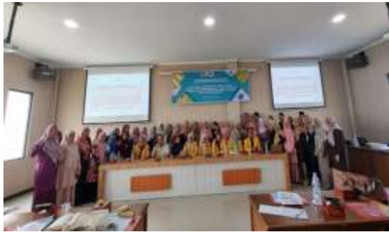
Gambar 7. Pembukaan Pengabdian