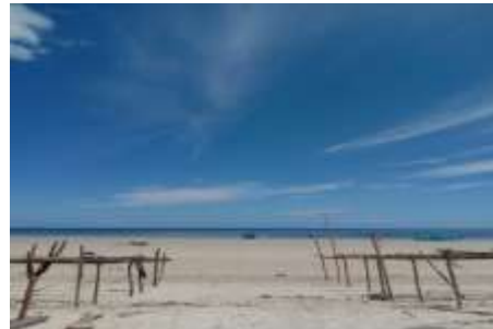
Gambar 4. Pantai Tanjung Indah Timbala

Gambar tersebut menunjukkan pemandangan Pantai Tanjung Indah Timbala dengan laut biru yang tenang dan hamparan pasir putih yang luas. Secara keseluruhan, suasana menunjukkan kemungkinan wisata bahari yang indah dan alami.