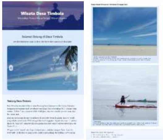
Gambar 1. Tampilan Website Promosi Wisata Desa Timbala

2. Edukasi Pengelolaan Wisata Berkelanjutan Mahasiswa meningkatkan kesadaran akan pentingnya menjaga kebersihan pantai, pengelolaan sampah, dan pelestarian lingkungan pesisir. Sekitar 25 warga mengikuti acara tersebut dan setuju untuk membersihkan pantai secara rutin setiap bulan.