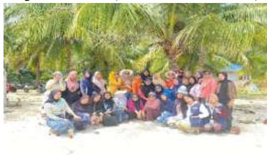
Gambar 2. Kegiatan Edukasi Kebersihan dan Pengelolaan Wisata

Aktivitas ini menunjukkan bagaimana prinsip wisata berbasis komunitas (CBT) diterapkan, di mana masyarakat berpartisipasi dalam pengelolaan dan pengelolaan sumber daya wisata. Keterlibatan masyarakat menunjukkan bahwa pengembangan wisata berbasis komunitas dapat meningkatkan rasa memiliki (sense of belonging) dan meningkatkan tanggung jawab lingkungan.