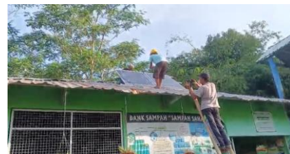
Gambar 1. Pemasangan Panel Surya

Tahap awal kegiatan berupa instalasi panel surya di lokasi Bank Sampah " Sampah Sahabatku ". Panel dipasang dengan kapasitas yang sesuai kebutuhan operasional mesin pencacah plastik dan kertas. Setelah instalasi, dilakukan uji coba untuk memastikan daya yang dihasilkan stabil dan mendukung kinerja peralatan. Hasil pengukuran menunjukkan panel surya mampu menyuplai energi alternatif sehingga mengurangi ketergantungan pada listrik konvensional dan menekan biaya operasional.