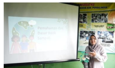
Gambar 2. Pelatihan Pemahaman Dasar Bank Sampah

Pelatihan dasar diberikan kepada 13 anggota komunitas terkait konsep bank sampah, pemilahan sampah, dan mekanisme tabungan sampah. Peserta, yang sebagian besar adalah ibu rumah tangga, memahami alur hulu-hilir mulai dari pengumpulan, pencatatan, hingga distribusi hasil. Evaluasi awal menunjukkan adanya peningkatan pengetahuan tentang kategori sampah bernilai ekonomi dan cara pengelolaannya.