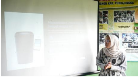
Gambar 3. Pelatihan Integrasi IoT dan Panel Surya dengan Bank Sampah

Selanjutnya dilakukan pelatihan integrasi teknologi sensor berbasis IoT dengan sistem panel surya. Peserta dilatih untuk membaca data dari sensor berat yang digunakan dalam pencatatan setoran sampah serta memantau status energi dari panel surya. Pelatihan ini menambah keterampilan teknis anggota komunitas, sehingga mereka dapat mengoperasikan perangkat secara mandiri sekaligus memahami manfaat teknologi dalam mendukung efisiensi bank sampah.