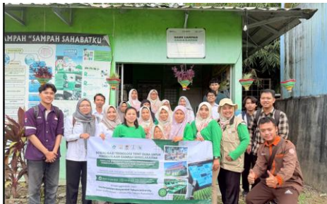
Gambar 5. Dokumentasi Kegiatan

Seluruh rangkaian kegiatan terdokumentasi dalam bentuk foto, video, serta catatan lapangan. Dokumentasi meliputi proses pemasangan panel surya, sesi pelatihan, praktik penggunaan mesin, hingga diskusi kelompok bersama mitra. Materi dokumentasi ini menjadi bukti pelaksanaan program sekaligus sumber pembelajaran bagi pihak lain yang ingin mereplikasi model kegiatan serupa. Selain itu, dokumentasi digunakan sebagai bahan publikasi di media massa dan media sosial untuk memperluas dampak kegiatan.