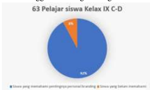
Gambar 8. Pengukuran pemahaman dan pengetahuan dari hasil post-test siswa kelas 9C-9D menggunakan diagram lingkaran.

Hasil menunjukkan bahwa siswa kelas 9C-9D setelah penyampaian materi dan diberikan soal post-test menunjukkan peningkatan yang signifikan. Sebagian besar mengetahui dan memahami pentingnya ketiga aspek yaitu personal branding, konten positif, dan manajemen waktu. Dari 63 siswa 58 siswa sudah mengetahui pentingnya ketiga aspek yang dibahas, dan hanya sebagian kecil yang mengetahui pentingnya secara umum. Serta, hanya 5 siswa yang masih belum paham secara umum terkait aspek yang dibahas.