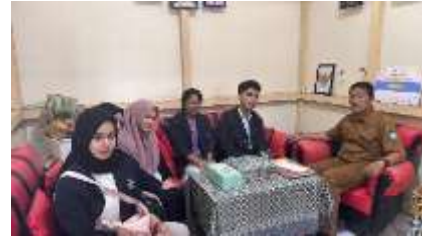
Gambar 3. Koordinasi awal terkait program kerja yang akan dilaksanakan kepada bapak Kepala Sekolah SMP Negeri 4 Sungai Raya

Framework ini menekankan pentingnya keterampilan digital yang mencakup akses informasi, keamanan digital, komunikasi melalui teknologi, dan penciptaan konten digital secara bertanggung jawab. Dalam kegiatan ini, siswa diajak tidak hanya menjadi penikmat konten, tetapi juga pencipta konten yang positif dan produktif di media sosial seperti TikTok. Sebagai bagian dari pelaksanaan kegiatan, dilakukan juga upaya untuk mengetahui dampak materi yang telah disampaikan kepada siswa. Untuk mengukur pemahaman siswa terhadap materi yang diberikan, digunakan evaluasi berupa pre-test dan post-test dalam format esai.