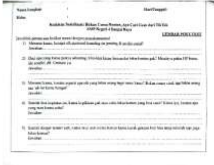
Gambar 2. Contoh soal post-test yang diberikan kepada siswa

Data hasil pre-test dan post-test dianalisis secara deskriptif kualitatif (qualitative descriptive analysis). Proses analisis dilakukan setelah semua sosialisasi selesai, dengan memeriksa jawaban satu per satu dan mencatatnya secara teratur, memisahkan hasil pre-test dan post-test. Tujuannya adalah untuk melihat seberapa besar pemahaman siswa meningkat setelah mengikuti sosialisasi ini.