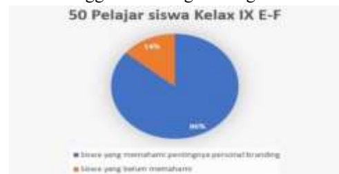
Gambar 10. Pengukuran pemahaman dan pengetahuan dari hasil post-test siswa kelas 9E-9F menggunakan diagram lingkaran.

Dari hasil diatas, menunjukkan peningkatan yang signifikan terhadap pemahaman siswa kelas 9E-9F setelah penyampaian materi dan pemberian soal post-test. Dari 50 siswa 43 diantaranya sudah memahami pentingnya ketiga aspek yang dibawakan sedangkan hanya tersisa 7 siswa saja yang masih kesulitan memahami ketiga aspek yang dibahas yaitu personal branding, konten yang positif, dan manajemen waktu.