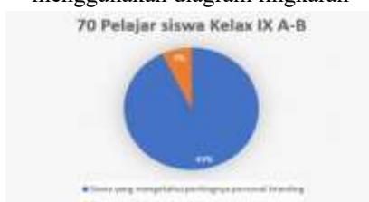
Gambar 6. Pengukuran pemahaman dan pengetahuan dari hasil post-test siswa kelas 9A-9B menggunakan diagram lingkaran

Hasil menunjukkan bahwa, dari 70 Siswa SMP kelas 9A-9B setelah penyampaian materi dan diberikan soal post-test menunjukkan peningkatan pemahaman dan pentingnya personal branding, konten yang positif, dan manajemen waktu antara belajar dan membuat konten. Dari diagram diatas, 65 siswa sudah paham mengenai pentingnya personal branding, konten yang positif. Dan manajemen waktu. Sedangkan 5 diantaranya masih belum mengetahui terkait pentingnya ketiga aspek yang dibahas.