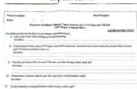
Gambar 1. Contoh soal pre-test yang diberikan kepada siswa

Penilaian jawaban siswa didasarkan pada tiga hal utama: (1) seberapa paham mereka tentang konsep materi, (2) seberapa dalam dan relevan jawaban mereka dengan pengalaman pribadi, dan (3)