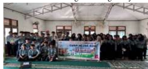
Gambar 11. Pelaksanaan kegiatan sosialisasi di mushola SMP Negeri 4 Sungai Raya

Secara umum, kegiatan sosialisasi ini telah memberikan dampak positif terhadap peningkatan pemahaman siswa. Pre-test dan post-test menjadi