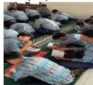
Gambar 4. Pemberian Soal pre-test dan post-test kepada para siswa

Soal terdiri dari lima pertanyaan terbuka yang mencakup tiga aspek utama, yaitu: (1) pemahaman tentang pentingnya personal branding di media sosial, (2) kemampuan menyusun ide konten berdasarkan minat dan potensi diri, serta (3) perencanaan waktu harian yang seimbang antara kegiatan sekolah dan aktivitas digital. Salah satu contoh soal pre-test adalah, “Menurut kamu, kenapa personal branding itu penting di media sosial?”, yang bertujuan mengukur pemahaman awal siswa terhadap konsep citra diri di platform digital. Setelah kegiatan sosialisasi, pertanyaan yang sama diajukan kembali pada post-test untuk melihat sejauh mana pemahaman siswa berkembang. Jawaban siswa dianalisis secara deskriptif kualitatif untuk mengidentifikasi perubahan isi, kedalaman makna, dan relevansi terhadap materi yang disampaikan. Pelaksanaan kegiatan di lapangan dilakukan melalui beberapa tahapan sebagai berikut: