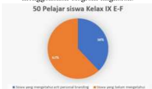
Gambar 9. Pengukuran pemahaman dan pengetahuan dari hasil pre-test siswa kelas 9E-9F menggunakan diagram lingkaran.

Dari 50 siswa, hanya 19 siswa yang memahami dan mengetahui apa itu personal branding, manajemen waktu dan pentingnya untuk citra diri di media sosial. Hal ini menunjukkan bahwa pemahaman sebagian besar siswa kelas 9E-9F masih tergolong rendah.