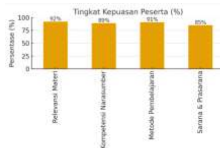
Gambar 2. Tingkat Kepuasan Peserta

Selain peningkatan pengetahuan, tingkat kepuasan peserta juga berada di level yang sangat tinggi di berbagai aspek. Survei menunjukkan bahwa mayoritas peserta merasa sangat puas dengan program ini. Sebanyak 92% peserta menyatakan materi yang diberikan memiliki relevansi tinggi dengan kebutuhan kerja mereka sehari-hari. Sementara itu, 89% peserta menilai kompetensi narasumber sangat baik dan mampu menyampaikan materi dengan jelas dan menarik. Lebih lanjut, 91% peserta merasa metode pembelajaran yang interaktif, seperti simulasi dan diskusi, sangat efektif dan membantu proses belajar mereka. Meskipun sarana dan prasarana mendapatkan persentase sedikit lebih rendah, yaitu 85%, angka ini tetap menunjukkan bahwa fasilitas yang disediakan sudah memadai untuk mendukung kelancaran kegiatan.