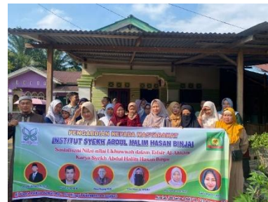
Gambar 3. Foto bersama setelah pelaksanaan kegiatan sosialisasi

Evaluasi melalui post-test menunjukkan peningkatan signifikan: sekitar 80% peserta mampu menjawab dengan benar pertanyaan mengenai prinsip ekonomi syariah dan praktik pengelolaan keuangan rumah tangga sesuai syariah. Wawancara singkat pasca kegiatan juga mengungkapkan bahwa ibu-ibu merasa termotivasi untuk lebih disiplin dalam mencatat arus keuangan keluarga dan mulai mempertimbangkan layanan keuangan syariah sebagai alternatif. Sebagai bentuk tindak lanjut, telah dibentuk grup WhatsApp yang diikuti oleh seluruh peserta. Grup ini berfungsi sebagai ruang berbagi pengalaman, bertanya mengenai praktik ekonomi syariah, serta wadah koordinasi untuk kegiatan lanjutan. Dalam dua minggu pertama pasca kegiatan, grup sudah aktif digunakan untuk diskusi mengenai produk tabungan syariah, tips belanja hemat, serta peluang usaha kecil berbasis syariah.