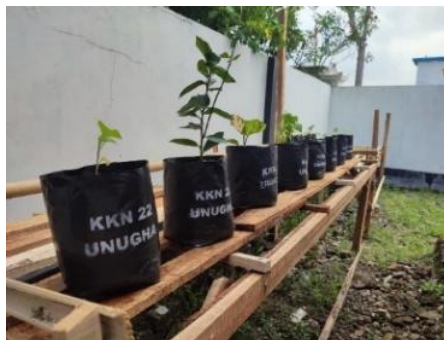
Gambar 2. Perawatan tanaman dengan POC di polybag

nabati yang berasal dari bahan alami, sehingga selaras dengan prinsip pertanian organik. Dengan perawatan teratur menggunakan pupuk organik cair (POC), tanaman cabai, terong, dan sawi hijau diharapkan tumbuh sehat, produktif, bebas residu kimia, sekaligus mendukung program Green Village yang ramah lingkungan.