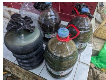
Gambar 1. POC yang sudah jadi

Simpan POC dalam botol atau jerigen tertutup rapat di tempat teduh. Untuk penyiraman atau penyemprotan tanaman, gunakan dengan dosis 10–15 ml pupuk organik cair (POC) per 1 liter air.