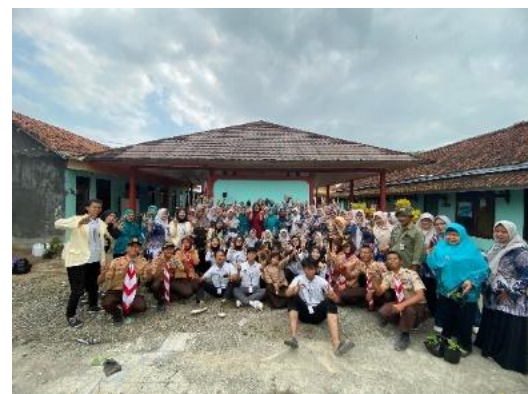
Gambar 3. Dokumentasi kegiatan Green Village & pelatihan pemanfaatan limbah rumah tangga menjadi pupuk organik cair bersama Ibu-Ibu PKK, BBH Wangon, Saka Tarunabumi, Mahasiswa KKN

Direkomendasikan agar program ini direplikasi di desa lain dengan dukungan pemerintah desa. Selain itu, penelitian lanjutan dengan pendekatan kuantitatif diperlukan untuk mengukur dampak jangka panjang program terhadap ketahanan pangan dan ekonomi warga.