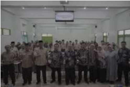
Gambar 2. Kegiatan interaksi guru-dosen-siswa

Bidang kemahasiswaan juga menjadi aspek penting dalam MoU ini. Mahasiswa Prodi Pendidikan Bahasa Arab UPI berkesempatan untuk melakukan praktik lapangan, penelitian, dan pengembangan proyek pembelajaran di MAN 1 Sleman. Sebaliknya, siswa MAN 1 Sleman memperoleh manfaat berupa pendampingan belajar, kegiatan ekstrakurikuler, serta motivasi akademik yang lebih variatif. Interaksi lintas jenjang pendidikan ini melahirkan iklim akademik yang sehat, kreatif, dan produktif bagi kedua belah pihak (lihat gambar 2).