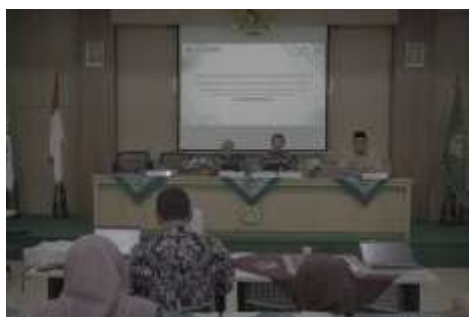
Gambar 1. suasana kegiatan

Pengabdian ini dilaksanakan melalui rangkaian kegiatan seminar, workshop, praktik pembelajaran, hingga penandatanganan nota kesepahaman (MoU) antara Program Studi Pendidikan Bahasa Arab FPBS UPI dengan MAN 1 Sleman (lihat gambar 1)