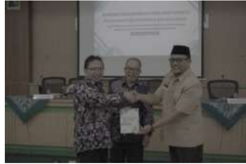
Gambar 3. Penyerahan penggunaan buku ajar bahasa Arab berbasis folklor

berbasis budaya Nusantara dan karakter (lihat gambar 3).