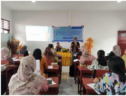
Gambar 2. Pelatihan Konseling Dasar

Materi terdiri dari 6 keterampilan konseling dasar yang harus dimiliki oleh pendidik. Pemaparan materi berlangsung selama 45 menit kemudian dilanjutkan dengan sesi tanya jawab Bersama peserta. Peserta antusias bertanya terkait hal-hal teknis dalam proses konseling. Setelah sesi tanya jawab dilanjutkan dengan roleplay Bersama peserta. Peserta dibagi menjadi 6 kelompok kemudian mereka diberi kasus untuk diskusikan selama 20 menit. Setelah itu, peserta melakukan roleplay menjadi siswa dan konselor.