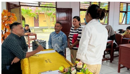
Gambar 3. Roleplay Peserta

Materi terdiri dari 6 keterampilan konseling dasar yang harus dimiliki oleh pendidik. Pemaparan materi berlangsung selama 45 menit kemudian dilanjutkan dengan sesi tanya jawab Bersama peserta. Peserta antusias bertanya terkait hal-hal teknis dalam proses konseling. Setelah sesi tanya jawab dilanjutkan dengan roleplay Bersama peserta. Peserta dibagi menjadi 6 kelompok kemudian mereka diberi kasus untuk diskusikan selama 20 menit. Setelah itu, peserta melakukan roleplay menjadi siswa dan konselor.