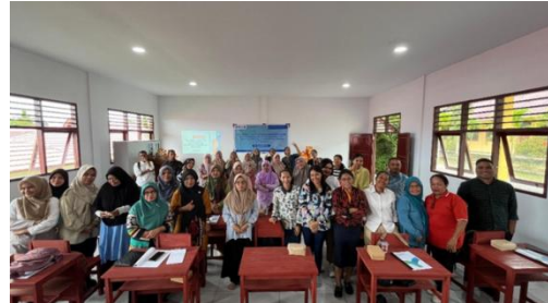
Gambar 6. Dokumentasi bersama peserta

Selanjutnya pada sesi penutupan dilakukan bersama dengan peserta dan pihak sekolah. Fasilitator menyampaikan kesan dan pesan kepada peserta dan sebaliknya peserta kepada fasilitator. Setelah itu, ada pemberian souvenir kepada pihak sekolah yang diwakili oleh kepala sekolah SMA N 37 Maluku Tengah.