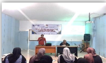
Gambar 1 : Sosialisasi Penyampaian Materi

Materi yang di sampaikan dalam pelatihan tersebut yaitu minat dan motivasi wirausaha, teknik menyusun rencana usaha serta manajemen usaha. Pemateri berasal dari dosen, pelaku usaha, dan Ketua BPC Himpunan Pengusaha Muda (HIPMI) Kabupaten Sintang.