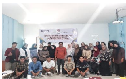
Gambar 2 : Foto dengan peserta setelah kegiatan