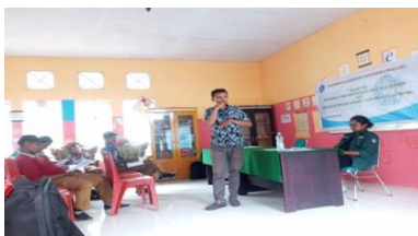
Gambar 3: Proses Penyampaian Materi Desa

Salain itu dipaparkan juga terkait urgensi penyusunan naskah akademik dalam proses pembentukan peraturan desa antara lain merupakan media nyata bagi partisipasi masyarakat dalam proses pembentukan peraturan desa, naskah akademik memaparkan alasan-alasan, fakta-fakta dan latar belakang tentang hal-hal yang mendorong disusunnya suatu masalah atau persoalan sehingga sangat penting dan mendesak diatur dalam peraturan desa. Naskah akademik menjelaskan aspekfilosofis, aspek sosiologis, aspek yuridis, aspek politik, aspek ekologi, aspek ekonomi dan aspek-aspek yang berkaitan dengan peraturan desa yang akan dibuat (Mahendra Putra Kurnia, 2007).