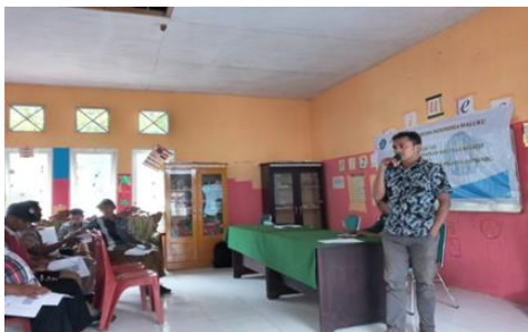
Gambar 2: Proses Penyampaian Materi

Hasil dari kegiatan penyuluhan ini adalah meningkatnya kesadaran hukum dan pemahaman pemerintah dan masyarakat Desa Labuan Kecamatan Seram Utara Barat, Kabupaten Maluku Tengah, Provinsi Maluku terkait dengan pembentukan Peraturan Desa dalam lingkup pemerintahan Desa. Keikutsertaan masyarakat sebagai salah satu bentuk partisipasi langsung dalam meningkatkan pemahaman terkait pembentukan Peraturan Desa yang berdampak pada pembangunan Desa Labuan itu sendiri. Salah satu asas penyelenggaraan pemerintahan desa yang diatur dalam Pasal 24 UU No. 6 Tahun 2014 tentang Desa adalah asas Partisipatif, yakni adanya keterlibatan masyarakat dalam penyelenggaraan pemerintahan desa diantaranya adalah keterlibatan masyarakat dalam pembentukan Peraturan Desa.