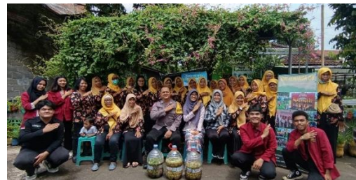
Gambar 7. Foto bersama anggota KWT dan POC

Hasil ini menunjukkan bahwa pelatihan dan pendampingan mampu memberikan dampak positif terhadap perubahan perilaku dan peningkatan kesadaran ekologis anggota KWT Kenanga. Hal ini sejalan dengan hasil Pengabdian Irma et al. (2022), yang menyebutkan bahwa pendekatan partisipatif dalam kegiatan pengabdian masyarakat efektif meningkatkan pengetahuan dan keterampilan dalam pengelolaan sampah organik. Penerapan metode fermentasi sederhana menggunakan EM4 dan gula merah terbukti efisien, ramah lingkungan, dan sesuai dengan kemampuan serta ketersediaan bahan di tingkat rumah tangga (Widyabudiningsih et al. , 2021).