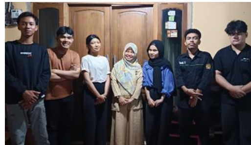
Gambar 3. Koordinasi dengan pengurus KWT

Kegiatan pengabdian ini melibatkan 33 anggota aktif Kelompok Wanita Tani (KWT) Kenanga sebagai responden. Seluruh peserta mengikuti rangkaian kegiatan mulai dari sosialisasi, pelatihan pembuatan pupuk organik cair (POC), proses fermentasi, hingga evaluasi.