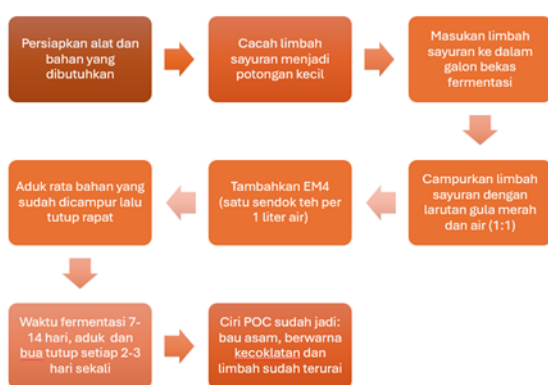
Gambar 2. Proses pembuatan POC

Langkah pembuatan POC tersaji pada gambar 2 sebagai berikut,