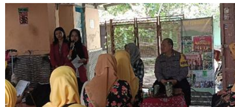
Gambar 4. Penyampaian Materi

Pengabdian masyarakat ini dilakukan dalam beberapa tahap, tahap awal dimulai dengan koordinasi bersama pengurus Kelompok Wanita Tani (KWT) Kenanga di Tegalkenongo RT.02, Tirtonirmolo, Bantul. Kegiatan ini bertujuan untuk menyusun jadwal pelaksanaan, menetapkan jumlah peserta, serta menyiapkan sarana dan bahan pelatihan, termasuk galon bekas, gula merah, EM4, dan air bersih.