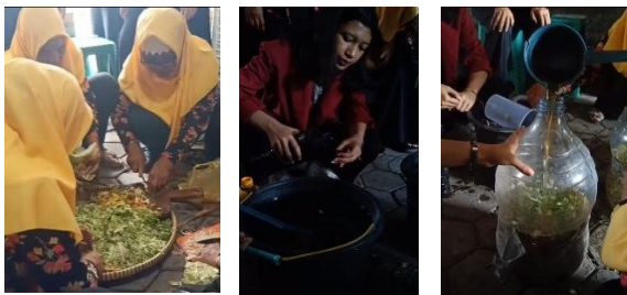
Gambar 6. Praktik Pembuatan POC

Saat penyampaian materi dilakukan, tim pengabdian juga membagikan brosur kepada anggota KWT Kenanga. Peserta juga diberikan pre-test untuk mengetahui pengetahuan awal mereka mengenai POC. Pelatihan dilakukan secara praktik langsung, melibatkan peserta dalam setiap tahap proses, mencacah limbah sayur (kubis, sawi, wortel, bayam), mencampur dengan larutan gula merah dan EM4, menuangkan ke dalam galon bekas dan menambahkan air bersih, menutup rapat galon dan melakukan fermentasi selama 10–14 hari.