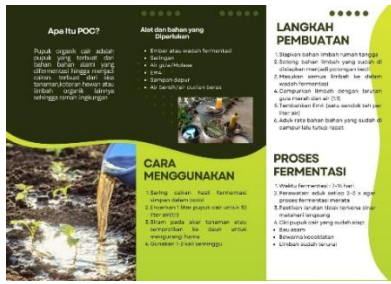
Gambar 5. Brosur pembuatan POC

Saat penyampaian materi dilakukan, tim pengabdian juga membagikan brosur kepada anggota KWT Kenanga. Peserta juga diberikan pre-test untuk mengetahui pengetahuan awal mereka mengenai POC. Pelatihan dilakukan secara praktik langsung, melibatkan peserta dalam setiap tahap proses, mencacah limbah sayur (kubis, sawi, wortel, bayam), mencampur dengan larutan gula merah dan EM4, menuangkan ke dalam galon bekas dan menambahkan air bersih, menutup rapat galon dan melakukan fermentasi selama 10–14 hari.