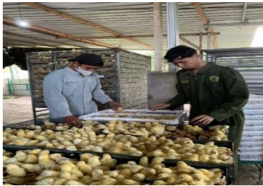
Gambar 7. Pull chick

Panen DOC, dimana telur sudah menetas dan dipilih anakan berdasarkan menetas atau tidaknya semua telur.