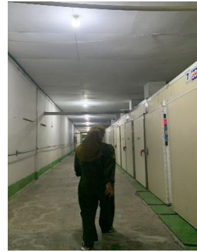
Gambar 4. Mesin setter

Mesin setter, juga dikenal sebagai mesin inkubasi, adalah tempat mengeringkan telur dan mengontrol suhu, kelembapan, dan rotasi. Suhu setter 34,7-37,7 dan kelembabapan 55%. (Neonub et al. , 2020)