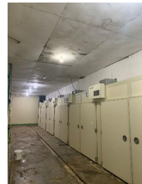
Gambar 5. Mesin hatchery

Mesin hatchery berfungsi sebagai tempat penetasan telur dan dikontrol suhu, kelembapan, serta rotasinya. Suhu setter 37,1-37,7 dan kelembabapan 65%.