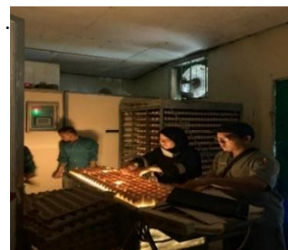
Gambar 6. Transfer telur

Pada umur 19 hari, sel telur pada mesin setter akan dikeluarkan untuk diketahui infertilitas dan kesuburannya melalui candling.(Lomboan et al. , 2022)