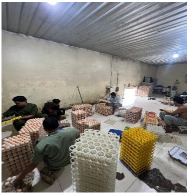
Gambar 3. Pelaksanaan grading

Grading merupakan tahap memilih telur yang bisa menetas untuk dipisahkan. Berat telur ideal dari gerakan ini adalah 55 gram. Selama proses berlangsung, telur-telur yang telah dipilih diletakkan pada setter tray dengan ujung yang tumpul berada di bagian atas. Suhu 20 hingga 25 derajat Fahrenheit diatur untuk penyimpanan telur. (Anwar et al. , 2021)