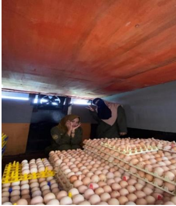
Gambar 2. Penerimaan telur

Telur induk siap dilakukan pemeriksaan fisik untuk mengetahui umurnya dan jumlah telur yang menetas pada saat masuk mesin tetas dari kandang