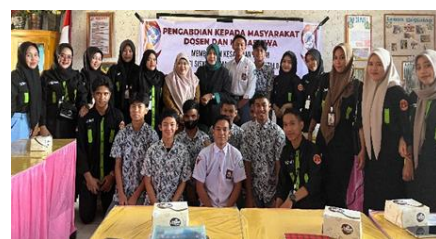
Gambar 4. Sesi Foto Bersama Siswa Siswi SMA Negeri 4 Gorontalo

Narasumber pun merespons dengan pendekatan dialogis, menggugah kesadaran siswa bahwa hukum bukan sekadar aturan tertulis, melainkan pedoman etis yang harus dijalani dengan kesadaran penuh sebagai bagian dari kehidupan berbangsa dan bernegara. Interaksi yang terjadi tidak hanya menunjukkan pemahaman kognitif siswa, tetapi juga menandakan tumbuhnya sensitivitas moral dan sikap reflektif terhadap pentingnya taat hukum sebagai bentuk tanggung jawab sosial. Dialog ini menjadi momen penting dalam membangun koneksi emosional antara siswa dan nilai-nilai hukum, yang diharapkan akan terus terinternalisasi dalam sikap dan tindakan mereka di masa depan.