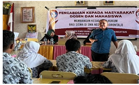
Gambar 3. Dialog Narasumber Dengan Peserta Didik Terkait Pentingnya Kesadaran Hukum

Melalui proses ini, siswa diajak untuk melihat hukum dalam kehidupan nyata bagaimana hukum bekerja dalam masyarakat dan bagaimana mereka sebagai individu memiliki peran di dalamnya. Keterlibatan aktif siswa dalam diskusi, studi kasus, dan refleksi menjadi indikator awal tumbuhnya kesadaran hukum yang tidak artifisial, melainkan lahir dari pengalaman langsung, pemahaman mendalam, dan kesadaran moral yang terbangun secara organik. Kesadaran inilah yang diharapkan menjadi fondasi bagi generasi muda dalam menginternalisasi nilai-nilai hukum dalam kehidupan sehari-hari, sebagai wujud nyata dari pendidikan kewarganegaraan yang transformatif.