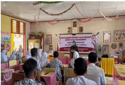
Gambar 2. Penyampaian Materi Sosialisasi

Hasil pengabdian Kolaborasi dosen dan mahasiswa Prodi S1 PPKn Universitas Negeri Gorontalo memberikan dampak positif, khususnya dalam menumbuhkan kesadaran hukum bagi siswa SMA Negeri 4 Gorontalo. dan Tidak hanya berhenti pada penguatan aspek kognitif, kegiatan ini juga merangsang dimensi afektif dan psikomotorik siswa melalui diskusi interaktif, simulasi kasus, dan refleksi atas fenomena sosial yang terjadi dalam kehidupan sehari-hari.