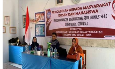
Gambar 4. Pelaksanaan Sosialisasi

bangga terhadap Indonesia. Dengan demikian, pemahaman yang lebih baik tentang teknologi akan seiring dengan penguatan karakter kebangsaan yang menjadi bagian dari upaya menciptakan generasi yang tidak hanya cerdas dalam teknologi, tetapi juga kuat dalam semangat kebangsaan.