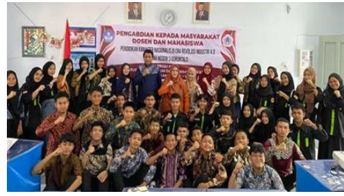
Gambar 6. Foto Bersama Siswa Siswi SMA Negeri 3 Gorontalo

Kedua, perlu dibangun ruang-ruang dialog produktif melalui pendampingan intensif oleh tim pelaksana program, baik dosen maupun mahasiswa, guna menanamkan semangat kebangsaan yang tidak rapuh diterpa arus globalisasi. Pendampingan ini diharapkan mampu menumbuhkan kesadaran kolektif siswa-siswi SMA Negeri 3 Gorontalo bahwa menjadi pelajar yang nasionalis bukan berarti ketinggalan zaman, tetapi justru menjadi garda depan dalam merawat identitas bangsa di tengah era digital. Dengan demikian, impian untuk melihat generasi muda yang tak hanya cakap teknologi, tapi juga berkarakter kuat dan berjiwa merah-putih, dapat benar-benar terwujud dalam laku nyata sehari-hari dan menjadi kompas moral masa depan mereka.