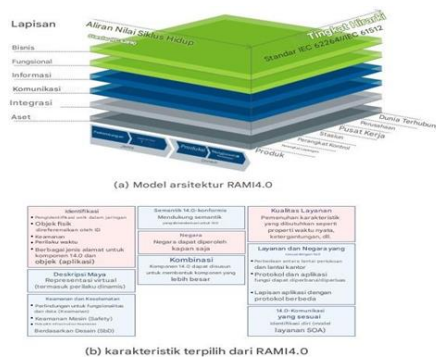
Gambar 1. karakteristik komponen Industri 4.0 (dalam Xu et al., 2021)

Xu et al., (2021) 4.0 Industri 4.0 merujuk pada integrasi cerdas antara mesin, jaringan, dan proses berbasis teknologi Cyber-Physical System (CPS), yang memungkinkan pengendalian cerdas melalui sistem jaringan tertanam. Meskipun terdapat beragam interpretasi mengenai konsep Industri 4.0, konsensus umum dicapai pada penggunaan Model Arsitektur Referensi Industri 4.0 (RAMI 4.0). Model ini dikembangkan oleh Asosiasi Produsen Listrik dan Elektronik Jerman ( ZVEI ) sebagai bagian dari inisiatif untuk mendukung penerapan Industri 4.0. RAMI 4.0 disusun dalam kerangka sistem koordinat tiga dimensi (Gbr. a)) yang merepresentasikan struktur arsitektur Industri 4.0. Sumbu "Tingkat Hirarki" berasal dari model informasi otomasi dan menunjukkan berbagai fungsi dalam lingkungan manufaktur; sumbu "Lapisan" menunjukkan pemecahan mesin ke dalam karakteristik komponennya; sementara sumbu "Siklus Hidup Aliran Nilai" mencerminkan siklus hidup produk dan fasilitas, mencakup pula model bisnis serta nilai tambah dari penerapan Industri 4.0. Bagian (b) menjelaskan berbagai karakteristik komponen Industri 4.0 sebagaimana digariskan dalam kerangka RAMI 4.0.