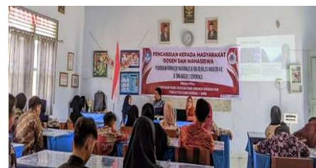
Gambar 5. Dialog Narasumber Dengan Peserta Didik Terkait Pentingnya Karakter Nasional Di Era 4.0

Ketiga materi tersebut dirancang untuk menanamkan kesadaran kritis kepada peserta didik tentang pentingnya membangun karakter nasionalis yang kokoh sebagai identitas dan pegangan moral dalam menghadapi tantangan dunia modern yang kian kompetitif dan terbuka. Kegiatan ini bertujuan agar siswa SMA Negeri 3 Gorontalo tidak hanya memahami nilai-nilai kebangsaan secara konseptual, tetapi juga mampu mengimplementasikannya secara konkret dalam kehidupan sehari-hari.